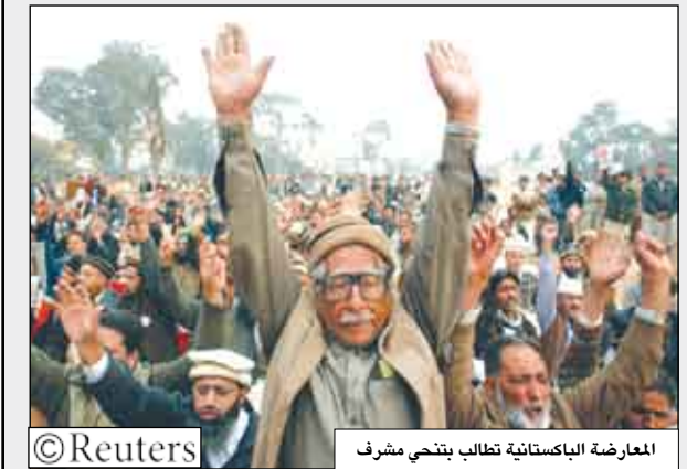
المعارضة الباكستانية تطالب بتنحي مشرف