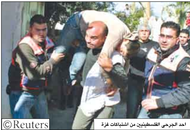
احد الجرحى الفلسطينيين من اشتباكات غزة

من التشطاء أصعبوا بجراح في الاشتباكات. ووقعت أعمال العنف قبل أسبوع من زيارة من المقرر أن يقوم بها الرئيس الأمريكي جورج بوش إلى المنطفقة المتابعة مؤتمر السلام الذي عقد في نوفمبر تشرين الثاني في اثابوليس بولاية ماريلاند حيث تعهد رئيس الوزراء الإسرائيلي ايهود اولمرت والرئيس الفلسطيني محمود عباس باستئناف المحادثات. وأشار الهجوم الصاروخي على عسقلان المخاوف في إسرائيل التي تقول إن الفصائل الفلسطينية تعزز إمكاناتها لصنع الأسلحة عن طريق تهريب ذخائر من مصر. وأعلنت جماعة الجهاد الإسلامي ولجان المقاومة الشعبية الفلسطينية المسئولة عن الهجوم الصاروخي. غير أن الجبهة الشعبية لتحرير فلسطين-القيادة العامة أعلنت أيضا مسئوليتها ونشرت شريط فيديو ذكرت انه التقط لإطلاق الصاروخ. وقال مارك ريجيف المتحدث باسم رئيس الوزراء الإسرائيلي «رغم أن السكان الملاصقين مباشرة لقطاع غزة كانوا حتى الآن هم وهدم النين يقعون في مدى النيران إلا انه بسبب