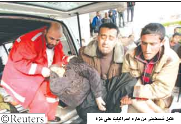
قتيل فلسطيني من غاره اسرائيلية على غزة