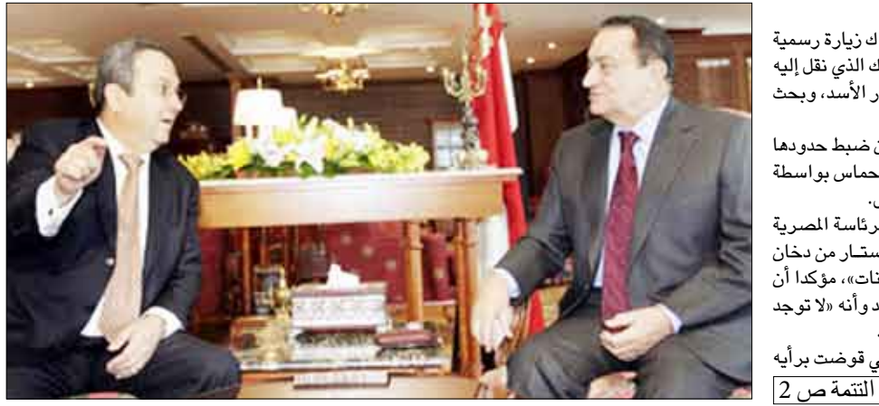
القاهرة / وكالات: أنهى وزير الدفاع الإسرائيلي يهود باراك زيارة رسمية إلى مصر التقى خلالها الرئيس حسني مبارك الذي نقل إليه -كما قيل- رسالة من الرئيس السوري بشار الأسد، وبحث معه عددا من المسائل الإقليمية. وخيمت الاتهامات الإسرائيلية لصر بشأن ضبط حدودها مع قطاع غزة لمنع تهريب الأسلحة إلى حركة حماس بواسطة الأنفاق، على المباحثات التي جرت أمس الأول. وفي هذا الإطار وصف المتحدث باسم الرئاسة المصرية سليمان عواد المزارع الإسرائيلي بأنها «ستار من دخان لتحويل الانتباه بعيدا عن البناء في المستوطنات»، مؤكدا أن مصر تبذل جهودها بالنسبة لسألة الحدود. وأنه «لا توجد دولة قادرة على ضبط حدودها بشكل كامل». وانتقد عواد التصرفات الإسرائيلية التي قوضت برأيه النتائج التي تمخضت