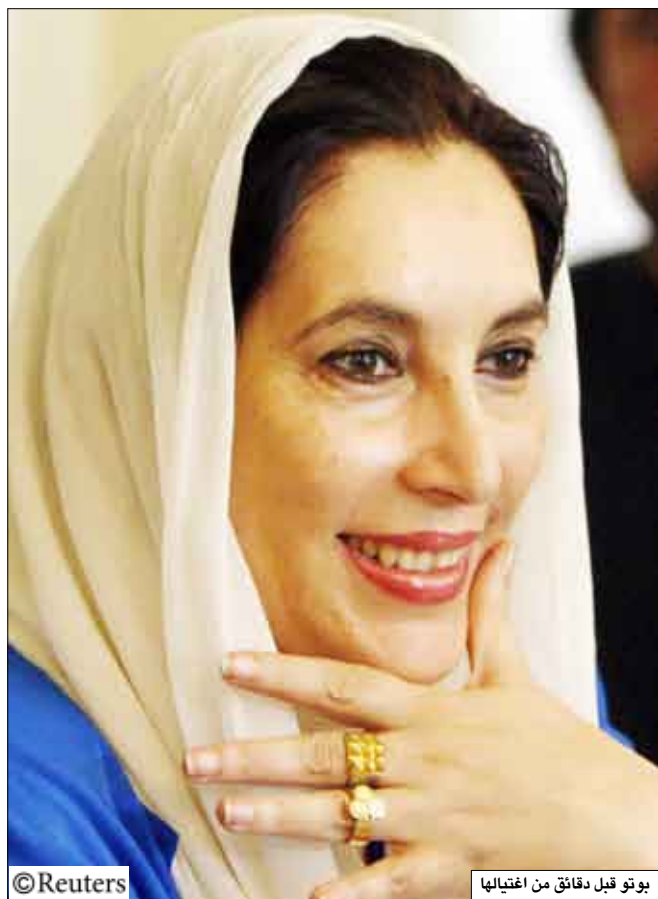
بو تو قبل دقائق من اغتيالها