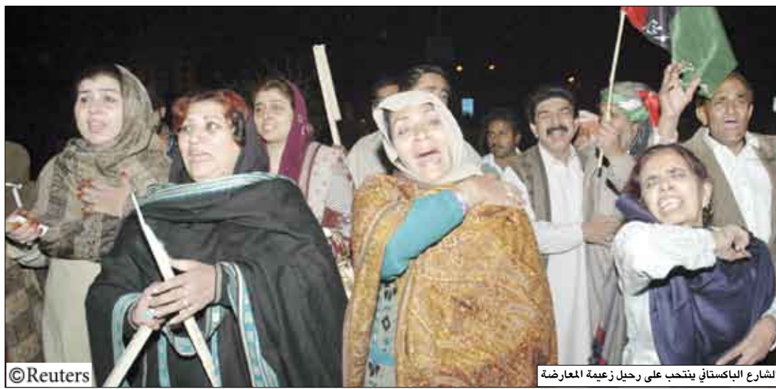
الشارع الباكستاني ينتخب على رحيل زعيمه المعارضة

□ صنعاء / سبأ: وتعب مرتكبي الحادث ليلوا جزءاً هاماً من العمل. العادل. وقال المصدر عن صادق تعازي ومواساة الحكومة والشعب اليمني، للحكومة والشعب الباكستاني الشقيق وإلى أسرة الزعيمه بي ناظير بوتو وأسرة ضحايا الحادث.. سائلاً الله سبحانه وتعالى أن يتغمد الفقيدة بوتو بواسع الرحمة ويسكنها فسيح جناته ويلهم أهلها وذويها الصبر والسلوان. إننا لله وإنا إليه راجعون. □ صنعاء / سبأ: دانت الجمهورية اليمنية واستنكرت بشدة التفجير الانتحاري الذي أودى بحياة السيدة بي نظير بوتو زعيمة حزب الشعب الباكستاني المعارض ورئيسة الوزراء السابقة لدى حضورها أمس الخميس تجعماً انتخابياً لحزبها في روالبندي بالعاصمة الباكستانية إسلام آباد. ووصف مصدر يمني مسؤول في تصريح لوكالة الأنباء اليمنية (سبأ) هذا التفجير بالعمل الإرهابي المؤسف.. معتبراً أن هذا التفجير الانتحاري الإرهابي، يستهدف زعزعة أمن باكستان ووحدة الوطنية. ودعا المصدر الحكومة الباكستانية وكافة القوى السياسية إلى التنبه لتلك المخططات وتقويت الفرصة عليها في تحقيق أهدافها، والتعامل مع هذا الاعتداء الأثم بحكمة وبما يحفظ أمن واستقرار باكستان ويصون البلاد من الانجرار في طريق العنف وردود الفعل. وأكد المصدر على أهمية تضافر الجهود الدولية لمكافحة الإرهاب والقضاء عليه