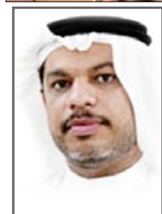
الشاعر البحريني / حسن الساميري