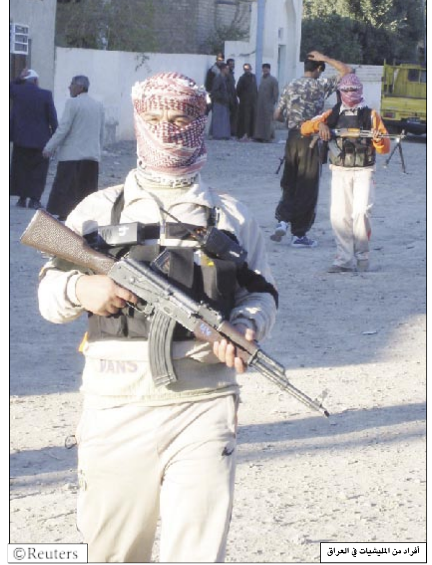
افراد من الميليشيات في العراق

بغداد/14 أكتوبر/رويترز/وكالات، شن مسلحون ومهاجمون ثلاثة هجمات على دورية تابعة لجالس الصحوة المدعومة من الولايات المتحدة في بغداد أمس السبت مما أدى إلى مقتل ثلاثة من أفراد الدورية وإصابة 17. وتعتمد القوات الأمريكية بدرجة متزايدة على دوريات مجالس الصحوة التي ساعدت على استعادة النظام في المناطق السنية العراقية في إطار استراتيجية أدت إلى خفض مستويات العنف بدرجة كبيرة خلال الأشهر القليلة الماضية. لكن أفراد هذه الدوريات الذين يحصلون على رواتبهم من القوات الأمريكية وليسوا من الناحية الرسمية جزءا من قوات الأمن العراقية تعرضوا بدرجة متزايدة لهجمات من جانب المتشددين. وفي حادثة أمس السبت قتل المهاجمون اثنين من أفراد دورية وأصابوا عشرة في هجوم على مقر دوريتهم في حي الأعظمية بشمال بغداد الذي كان حتى وقت قريب من معاقل السنة المتشددين. وهاجم مسلحون دورية في منطقة أخرى وقتلوا احد أفرادها وأصابوا أربعة. وفي ضاحية الدورة الجنوبية وهي مغلقة آخر سابق للسنة أصاب مسلحون ثلاثة من أفراد دورية يحرسون نقطة تفتيش. وتحاول القوات الأمريكية عزل مقاتلي القاعدة من خلال تجنيد أفراد من العرب السنة الذين انقلبوا على السنة المتشددين. وينسب قادة أمريكيون الفضل إلى هذا التكتيك باعتباره من الأسباب الرئيسية وراء تراجع عدد الهجمات في أنحاء العراق بنسبة 60 في المائة منذ يونيو.