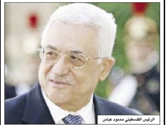
الرئيس الفلسطيني محمود عباس