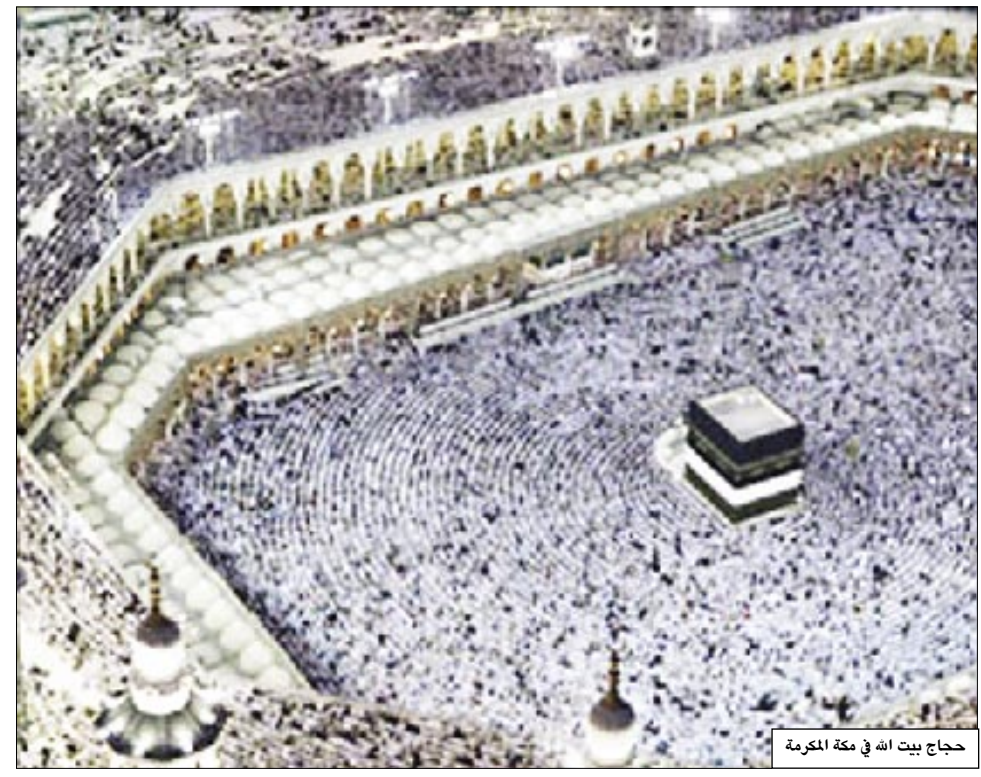
حجاج بيت الله في مكة المكرمة

مكة المكرمة/وكالات، يبدأ الملايين من المسلمين مناسك الحج غداً الاثنين، في ظل إجراءات جديدة فرضتها السلطات السعودية لمنع تكرار حوادث التدافع أثناء أداء الشعائر. وذكّرت وكالة الأنباء السعودية الرسمية أن وسائل توعية حديثة تم اتخاذها هذا العام للمرة الأولى لهذا الغرض، كما حضت المملكة طاقاتها في مكة المكرمة ومنى المدينة المنورة لتأمين سير موسم الحج بسلاسة وسلام. وقالت الوكالة: إن أمانة مكة أعدت خطة عمل لتقديم خدماتها لحجاج بيت الله الحرام على مدار الأربعة والعشرين ساعة منذ وصولهم إلى الديار المقدسة حتى مغادرتهم بسلاسة إلى بلدانهم. وأوضحت أن هذه الخطة دخلت حيز التطبيق اعتباراً من 21 ذو القعدة الماضي، وتستمر حتى نهاية ذي الحجة الحالي. وتتضمن الخطة حشد الطاقات البشرية بجميع قطاعات الأمانة لخدمة ضيوف الرحمن في مكة المكرمة والمشاعر المقدسة، وتجهيز المعدات والآليات وتسخير كل الإمكانيات اللازمة لتقديم الخدمات على أعلى المستويات. وقالت الوكالة السعودية: إن أمانة العاصمة المقدسة أخذت في الاعتبار عند إعداد الخطة توصيات لجنة الحج المركزية للارتقاء بمستوى الخدمات، والاستفادة من الدراسات الميدانية والمعلومات ونتائج مناقشة تقارير القطاعات العاملة في موسم حج العام الماضي. كما أشارت إلى المشاريع الجديدة التي تنفذ في مكة المكرمة والمشاعر المقدسة، ومن بينها مشروع تطوير الساحات وجسر الجمرات،