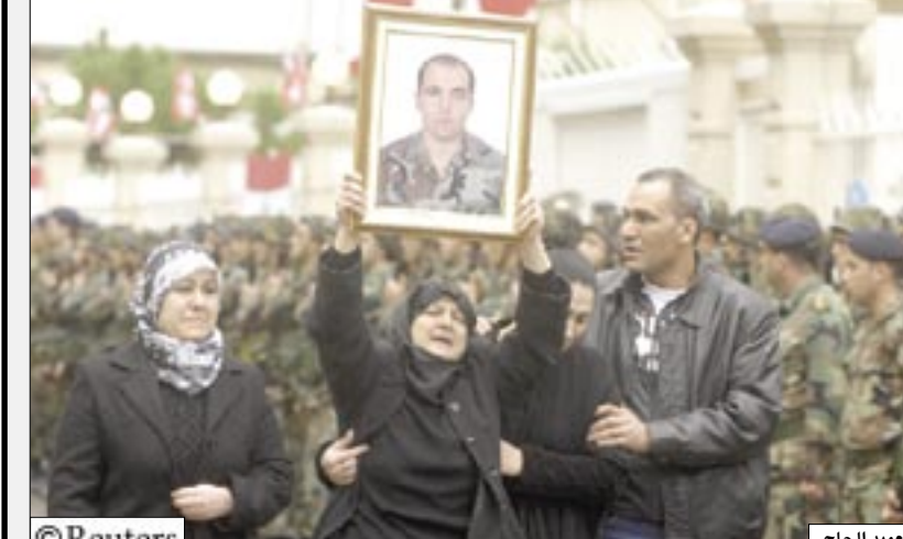
تشيع جنازة العميد الحاج