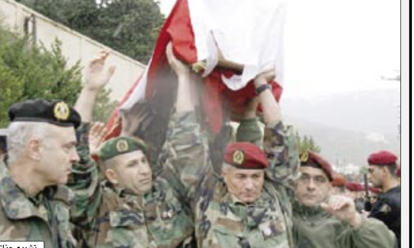
تشيع جنازة العميد الحاج

لكن في نهاية الأمر ترغب الأغلبية الحاكمة التي يؤيدها الغرب في وجود جيش قوي يتولى المسؤولية الكاملة عن حماية حدود البلاد فور نزع سلاح حزب الله والمليشيات الفلسطينية. وهذه لعنة تطارد حزب الله، الذي يقول إن أسلحته ضرورية لصد أي عدوان إسرائيلي مادامت القوات اللبنانية ضعيفة وغير كافية التسليح. البقية ص 2