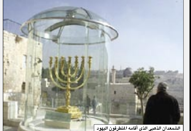
الشمعدان الذهبي الذي أقامه المتطرفون اليهود

فلسطين المحتلة / وكالات، كشفت مؤسسة الأقصى لإعمار المقدسات الإسلامية عن خطوة جديدة اتخذتها إسرائيل والمنظمات اليهودية في إطار مخططات تهويد القدس وإقامة الهيكل المزعوم. وبعد جولة ميدانية قامت بها المؤسسة في المسجد الأقصى ومحيطه صباح أمس قالت المؤسسة، إن منظمة ما يسمى "معهد الهيكل" قامت بصبب شمعدان ذهبي أطلقت عليه اسم شمعدان الهيكل قبالة باب المغاربة قرب الجهة الغربية للمسجد الأقصى. وتعهد معهد الهيكل نصب هذا الشمعدان في موقع يجيب رؤية المسجد الأقصى وقبة الصخرة، وأنهم على أمية الاستعداد لنقله إلى داخل الهيكل الذي يسعون إلى بناؤه على حساب المسجد الأقصى. وذكر بيان مؤسسة الأقصى أن معهد الهيكل "قام في الفترة الأخيرة بتجهيز تاج خاص للهيكل الأكبر الموعود للهيكل الثالث المزعوم. وأوضحت المؤسسة أن هذا الشمعدان كان قد وضع لسنتين في أحد شوارع البلدة القديمة في القدس، وأجرى ما يسمى بمعهد الهيكل إضافات عليه بتكلفة 100 دولار وقاموا بنصبه مؤخرا على موقع ظاهر وعال يقابل المسجد الأقصى من الغرب. وحسب ما قاله ما يسمى "معهد الهيكل فإنه تم صناعة الشمعدان من الذهب الخالص بوزن 45 كغم من عيار 24 قيراطا وبتكلفة 3 ملايين دولار. وحذرت مؤسسة الأقصى في بيانها من الخطوات التدريجية التي تتصاعد يوميا من جانب المنظمات الإسرائيلية لبناء الهيكل المزعوم. (التتمة ص 2)