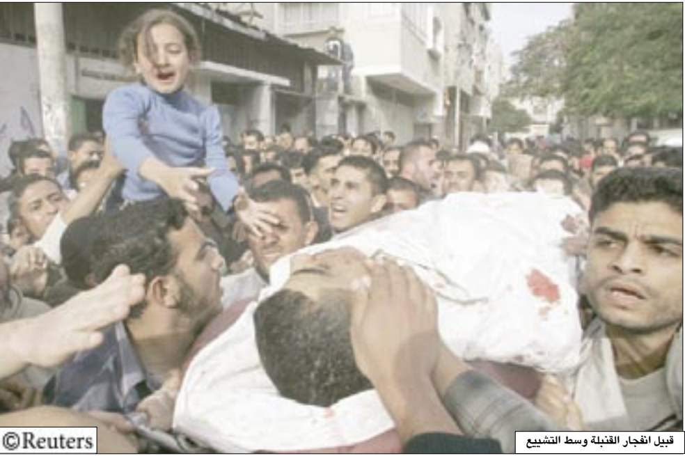
قبيل انفجار القبلة وسط التشيع