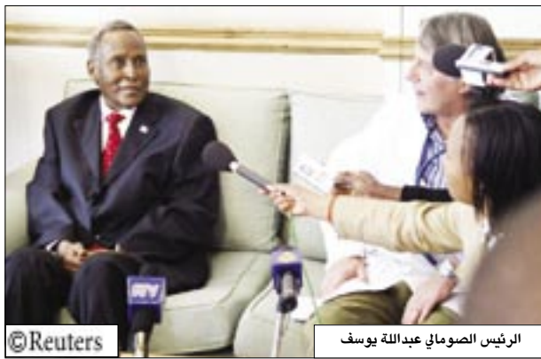
الرئيس الصومالي عبدالله يوسف

▣ نيروبي/مقديشو 14 أكتوبر / من سي. بريسون هال: قال الرئيس الصومالي عبد الله يوسف أمس الجمعة انه في صحة جيدة بعد ان تخافى من إصابته بالتهاب شعبي وسخر من التقارير التي تحدثت عن قرب وفاته.