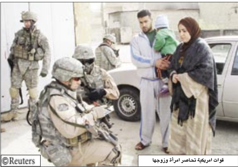
قوات امريكية تحاصر امرأة وزوجها

وفي سبتمبر لحقت أضرار بالخط بسبب تفجير قنبلة على ما يبدو. وقال مسؤولون إن الهجوم لم يؤثر على صادرات النفط الخام إلى ميناء جيهان التركي المطل على البحر المتوسط.