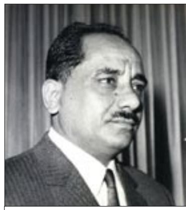
الرئيس قحطان الشعبي

في مساء يوم الاستقلال أصدر الرئيس قحطان محمد الشعبي المرسوم الجمهوري رقم 1/ ونصه كما يلي : أنا قحطان محمد الشعبي رئيس جمهورية اليمن الجنوبية الشعبية، أصدر بموجب الصلاحيات المخولة لي من قبل القيادة العامة للجبهة القومية بوصفها السلطة التشريعية في الجمهورية مايلي :