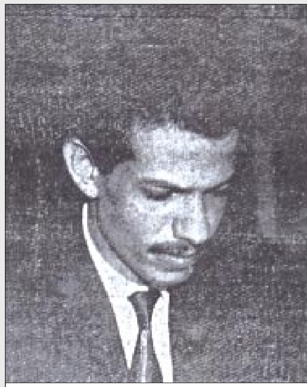
عبدالفتاح إسماعيل يلقي بيان وقرارات القيادة العامة للجبهة القومية صباح يوم الاستقلال

إعداداً كافياً ويتسلح بالوعي ويتسلح بالإيمان بقضية يستمر في طريق النضال. إن مرحلة جديدة من النضال الجماهيري تطل علينا ولابد أن نجابهها بكل شجاعة وصمود وأن التخلي الذي فرضه المستعمر لابد من مجابهته فحن بالنسبة للجانب الزراعي في بلد مختلف .. في بلد لا يمتلك أي شيء من وسائل التصنيع الحديث. وهذا بالتالي سيحتاج منا الى برنامج وخطة للإصلاح الزراعي حتى نستطيع ان نجابه هذا التخلف في هذا الميدان واننا فعلاً نعتمد على الفلاحين وعلى طاقاتهم الثورية في بناء ريف أفضل في بناء ريف سعيد على المستوى الاقتصادي والتجاري والصناعي لابد من خطط تنمية لمواجهة هذا التخلف في هذا المجال، ولكي نستطيع الثورة فعلاً ان توجد خطة تنمية للمرحلة القادمة حتى نستطيع ان نتحارب الفقر وتحارب الجهل وتحارب المرض وتوجد جيلاً قويا وتبني حضارة مدنية قوية، لذلك فلا بد فعلاً من أن يكون التنظيم الشعبي والجماهيري في بقية دائمة وفي تسليح دائم لمجابهة المرحلة القادمة ولجراسة الثورة حتى يستطيع الشعب ان يسير نحو تحقيق الانتصارات تلو الانتصارات وأيضاً لابد للجماهير ولابد لتنظيم الجبهة القومية مستقبلاً ان يحمي ثورته من خلال السلطة.