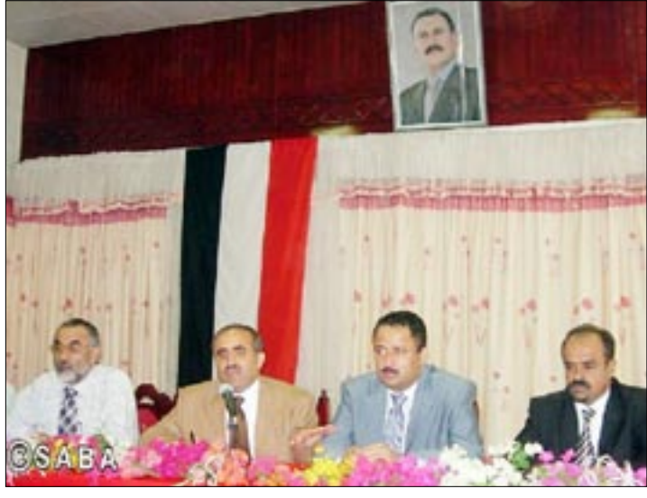
ويشارك فيها 26 متدرجا من قيادة السلطة المحلية وتهدف الدورة إلى تفعيل المجتمعات المحلية في مجال التنمية.

وخلال لقائه أسس المتقاعدين في القطاعات الإنتاجية في محافظة عدن بحضور الأخ المحافظ / أحمد محمد الكحلاني أوضح / الصوني أن من بين تلك المعالجات شراء سنوات الخدمة بالتقاعد المبكر وتطبيق نفس الإجراءات والمزايا التي حصل عليها العاملون الذين ما يزالون في الخدمة وخاصة رفع الحد الأدنى من للأجور إلى (20) ألف ريال، وكذا صرف الزيادة المستحقة لهؤلاء العمال بمبلغ مليار و(600) ريال اعتباراً من شهر يوليو 2005م، مؤكداً أن عملية الصرف لهذه المستحقات ستبدأ من يوم السبت المقبل الموافق 8 ديسمبر الجاري.