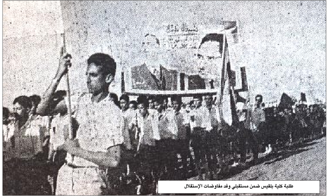
طلبة كلية بلقيس ضمن مستقبلي وفد مفاوضات الإستقلال