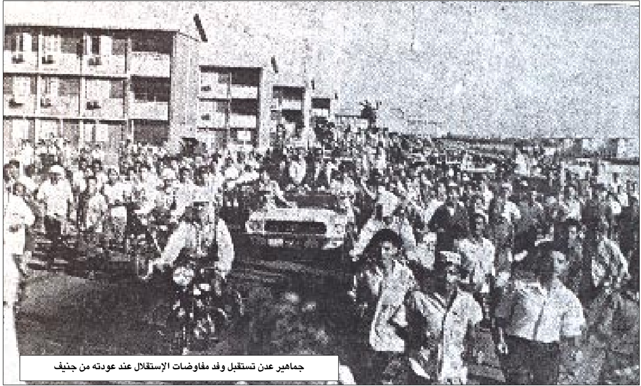
جماهير عدن تستقبل وفد مفاوضات الإستقلال عند عودته من جنيف

ولقد حقق شعبنا هذه الانتصارات الكبيرة بفضل تنظيمه الطبيعي مثلاً بالجبهة القومية، لذا فإن الجمهورية ستعمل جاهدة على رعاية العمل الشعبي المنظم وإفساح المجال له إيماناً منها بأن الشعب هو صاحب الثورة وصانعها وإن العمل المنظم هو السبيل لتعبئة الجماهير في خط الثورة وعلى هدى