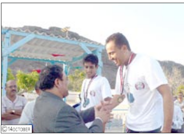
الوزير يعد بمنح السباح الجعدي شقة هدية من الرئيس إذا أحرز ميدالية في أولمبياد بكين