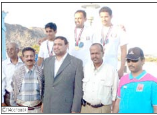
الوزير يعد بمنح السباح الجعدي شقة هدية من الرئيس إذا أحرز ميدالية في أولمبياد بكين