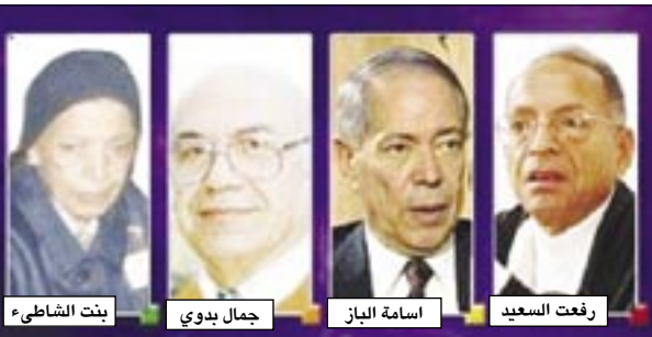
القاهرة / متابعيات ،