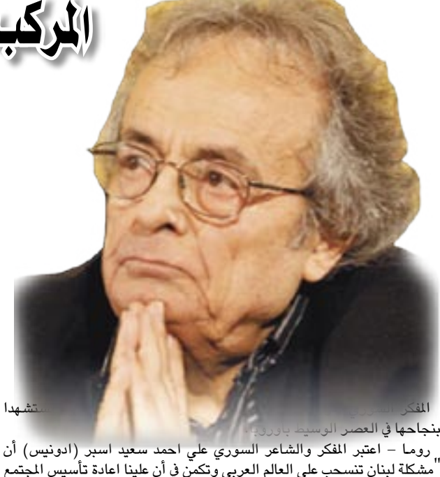
المخبر في العصر الوسيط، رونوما - اعتبر الفكر والشاعر السوري علي أحمد سعيد اسبر (ادونيس) أن مشكلة لبنان تنسحب على العالم العربي وتكمن في أن علينا إعادة تأسيس المجتمع

المجتمع الألماني الذي سعى بعد الحرب بكل قوته إلى العودة بسرعة إلى الحياة "العادية"، وكان فترة النازية لم تكن ، وبالرغم من الجدل الشديد الذي أثارته الرواية وقت صدورها وانتهاكات كثيرين للكتاب بالإباحية والخلاعة والتهمج على المسيحية، فإن "الطبل الصفيح" كانت مقفاح جراس للشهرة العالمية التي رسختها بمواقفه الصائبة سياسياً التي منحها صداقية كبيرة حولته إلى مؤسسة أخلاقية. صنف الكاتب كسياسي وليس أدبي بوجهة نظر النقاد منذ صدور روايته "الطبل الصفيح" وحتى العام الفائت حينما صدرت له "عند تقشير البصل" ، حينما ألقى في مطلع الشباب، وجرح في وتبوس cottbus ونقل على أثر ذلك إلى المستشفى العسكري حيث وقع أسيراً للقوات الأمريكية ببنهاية الحروب. وبعد إطلاق سراحه عمل مزارعاً ثم عمالاً في منجم الليوتاسيوم. وفي عام 1947 بدأ دراسة النحت في دوسلدورف Dusseldorf. وما بين عامي 1953 و1955 درس النحت، والجرافيك بأكاديمية الفنون الرفيعة بغرب برلين، وقام برحلات لإيطاليا وفرنسا وسويسرا. تزوج جراس مرتين: الأولى من أنا مارجريتا شورارتز عام 1954 وطلقها عام 1978، والثانية عام 1979 من أوتي جرونرث. في عام 1956 انتقل مع أتا -