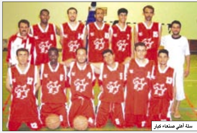
سلة اهلي صنعاء كيار