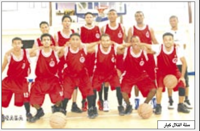
سلة التلال كيار

فيما تأهل فريق التلال بعد فوزه على فريق سيئون (72 / 39) في المباراة الثانية التي جرت اليوم بالصالة الرياضية المغلقة بـ عدن ، وكان التلال فاز بالمباراة الأولى أمس بنتيجة (68 / 45) . فيما صعد فريقا شعب إب وطلعية شبام بعد تعادلها في عدد النقاط 3 حيث تغلب فريق شعب إب في المباراة الأولى بنتيجة (64 / 60) فيما تغلب طلعية شبام في المباراة الثانية بـ (55 / 44) . وكانت منافسات فئة الناشئين لسابقة كأس قد أسفرت عن تأهل أندية " أهلي صنعاء ، التلال ، شعب حضرموت ، ووحدة عدن " إلى دور الأربعة من بطولة كأس رئيس الجمهورية .