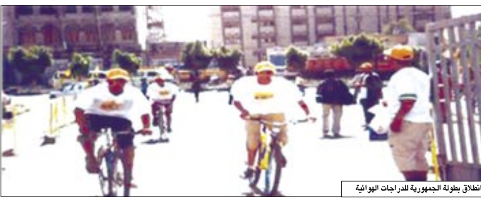
انطلاق بطولة الجمهورية للدراجات الهوائية

متراً انطلاقاً من ساحة العروض مروراً بشوارع عدن وانتهاءً بالساحة مرة أخرى. ونوه المدير العام لوكالة الأنباء اليمنية (سبأ) أن منافسات الدورة قبل النهائي للفتين الكبار والناشئين سيتم تحديده في اجتماع اللجنة الذي سيُعقد خلال اليومين القادمين، منوها إلى أن بطولة كأس تاتي بعد أن رحل الاتحاد العام المنحل إقامة هذه البطولة من العام 2006 إلى العام الجاري 2007 بسبب المشاكل والعواقب والتغيرات التي صاحبت الاتحاد السابق التي أدت في نهاية المطاف إلى إصدار وزير الشباب والرياضة حمود عباد قرارا بحل الاتحاد وتعيين لجنة مؤقتة لتسيير أنشطة الاتحاد برئاسة البرلماني الخضّر العزاني رئيس اتحاد السلة السابق.