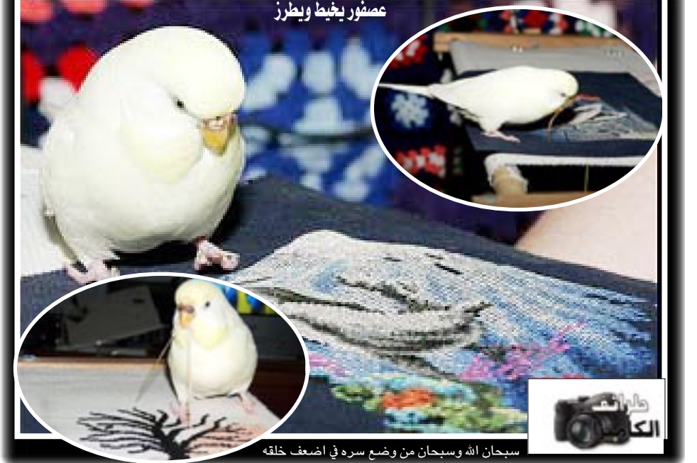
سبحان الله وسبحان من وضع سره في اصغف خلقه

١٩٤٧م: وفاة الشاعر المهجري إيليا أبو ماضي. ١٩٥٣م: صدور قرار مجلس الأمن رقم ١٠١ لسنة ١٩٥٣ بإدانة إسرائيل عقب ارتكاب منذبة قبية. ١٩٩٨/١١/٢٤م: افتتاح مطار فلسطين في غزة. ١٩٨٦م: افتتاح جسر الحبة الذي ربط البحرين بالأراضي السعودية بطول ٢٥ كيلو متراً فوق مياه الخليج العربي. ١٩٨٦/١١/٢٤م: مولد المؤرخ اللبناني امين الريحاني. ١٩٨٣/١١/٢٤م: وجود مصانع تعمل بالطاقة الشمسية حيث يعتبر مصنع برونو الذي يقع على مقربة من مدينة ليون الفرنسية اول مصنع يعمل بالطاقة الشمسية . ١٩٢٩/١١/٢٤م: وفاة السياسي الفرنسي جورج كليمنصو الذي رأس فرنسا أثناء الحرب العالمية الاولي. ١٨٦٤/١١/٢٤م: مولد الرسام الفرنسي الشهير تولوز لوتريك من المدرسة التأثيرية ١٩٣٢/١١/٢٤م: مولد الفيلسوف الهولندي الكبير سبينوزا و هو من الذين ارسوا اصول الفكر الحديث