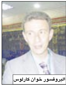
البروفسور خوان كارلوس

الضيوف المشاركين وعليه يمكن القول بأن هذا المؤتمر ناجح بكافة المقاييس فلقد كان عدد الحضور أكثر من المتوقع من بينهم أطباء الامتياز إضافة إلى بعض الطلبة الذين حضروا من محافظات أخرى.