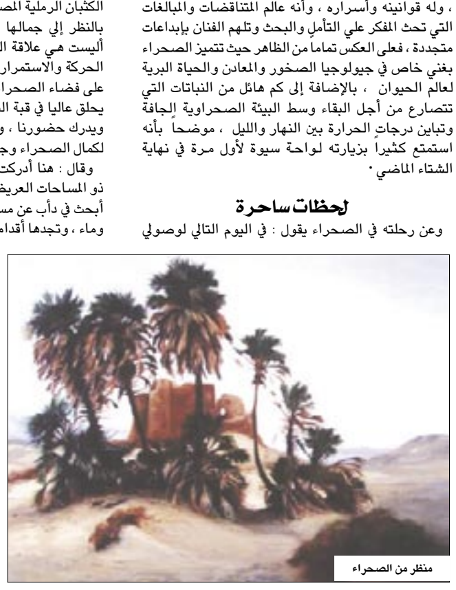
منظر من الصحراء

وحول لوحاته وأعماله التصويرية عن واحة سيوة أكد فاضل : أن سيوة هي أرض الحلم وجزيرة العجائب وسط بحر الرمال يلقيها الغموض من كل جانب وتيقع فوق مضاهيها أطلال تاريخها العتيق وسحر الطبيعة ، يتنافس سحر النبوءة ، فطلما نشد العظماء أسرار المستقبل بين جنات معبد آمون الشهير ، عراقته لا تشتري بالذهب واكتبتها زيارة الإسكندر الأكبر ابن العشرين قاهر العالم القديم ، ولهذا حاولت رسم " أطلال أغوربي في واحة سيوة بالزيت على القماش " وعن ذكرياته الجميلة في سيوة قال