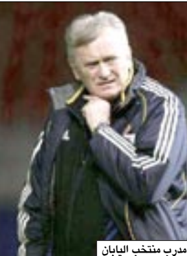
مدرب منتخب اليابان