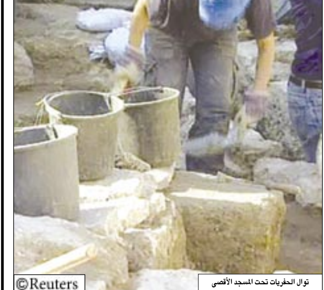
توال الحفريات تحت المسجد الأقصى