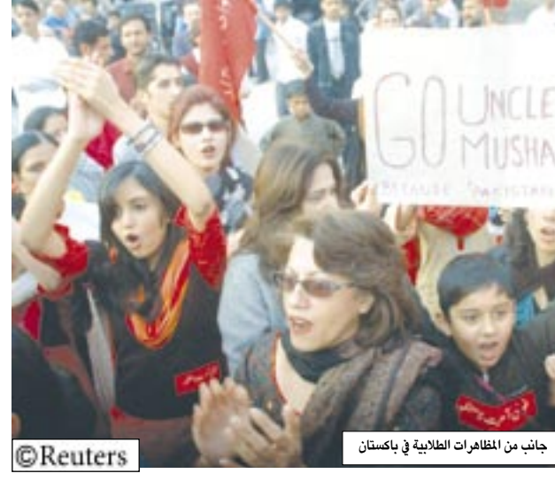
جانب من المظاهرات الطلابية في باكستان

وتعرض مشرف لضغوط متنامية من جانب حلفائه الغربيين ليعيد باكستان إلى طريق الديمقراطية. وامتنع مشرف عن تحديد موعد لإعادة العمل بالدستور. وقال إن الطوارئ ستصمّن إجراء انتخابات نزيهة التي وعد بإجرائها بحلول التاسع من يناير. ومن المقرر أن يزور نائب وزيرة الخارجية الأمريكية جون نيجروبوتني باكستان في وقت لاحق هذا الأسبوع. وكان نيجروبوتني قد حذر الأسبوع الماضي من قطع المعونة عن حليف أمّني "لا يمكن الاستغناء عنه". ومن المتوقع ان يدعو نيجروبوتني مشرف لإنهاء حكم الطوارئ. وتأتيه قال رئيس وزراء باكستان السابق المفتي نواز شريف "أنا رئيسة الوزراء السابقة بينظير بوتو ضد حكم الرئيس برويز مشرف. وقال شريف "نحن مستعدون لتجنب خلافاتنا مع حزب الشعب والعمل من أجل عودة الحكم الديمقراطي مشيرا إلى الحزب الذي تنترزه بوتو.