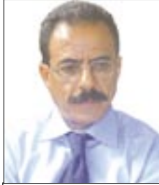
يكتبها: نعمان الحكيم

من بين البرامج الإذاعية الناجحة .. (برنامج ما يصم إلا الصحيح) البرنامج الناقد الهادف إلى إصلاح حال إعوجاج أمور الحياة .. فهو برنامج خفيف في مادته ووقتته لكنه بليغ وذو باع طويل فدقائق معدودة تساوي من ساعات لفائدت الجمة للناس جميعا ..