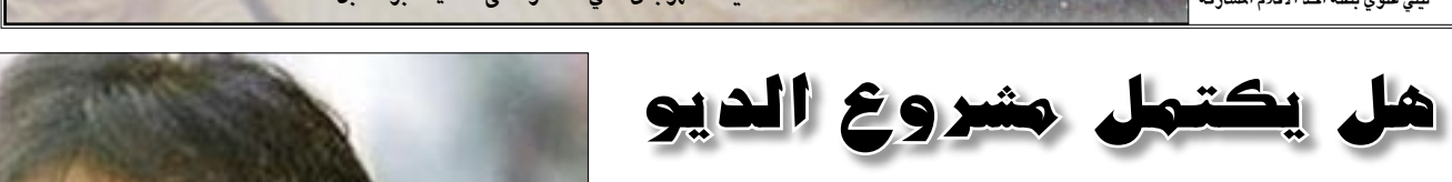
ليلى علوي بطلة احد الافلام المشاركة