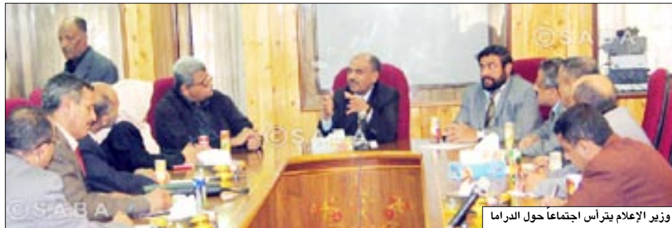
وزير الإعلام يترأس اجتماعاً حول الدراما

□ صنعاء / سيأ، أكد وزير الإعلام حسن احمد اللوزي ضرورة إشراك الأديباء والكتاب والمؤلفين اليمنيين في إجراء الإنتاج الدرامي الإذاعي والتلفزيوني ليسهموا في الارتقاء به إلى المستوى المنشود . جاء ذلك خلال اجتماع الأخ الوزير أمس برئيس وأمين عام اتحاد الأديباء والكتاب اليمنيين ورئيس نادي القصة (المققة) بصنعاء بحضور وكيل وزارة الإعلام احمد ناصر الحماطي ومدير عام المؤسسة العامة للإذاعة والتلفزيون الدكتور عبد الله الزلب، حيث أشار وزير الإعلام إلى التحديات التي تواجه الأعمال الدرامية وتحد من انطلاقها رغم غزارة الإنتاج الإذاعي للأديباء والكتاب اليمنيين في مجال المسرح والقصة القصيرة والرواية . وتطرقت الأوزير إلى الدور الذي يجب أن يضطلع به الأديباء والكتاب اليمنيون للارتقاء بالعمل الدرامي التلفزيوني والإذاعي باعتبارهم يمثلون الحلقة الأهم في عملية الإبداع بمختلف