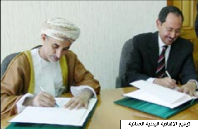
توقيع الاتفاقية الإطارية العمالية

□ صنعاء / سيأ، وقع أمس بوزارة التخطيط والتعاون الدولي على الاتفاقية الإطارية المتعلقة بتخصيص المنحة العمالية المقدمة للجمهورية اليمنية خلال مؤتمر لندن للمانحين والبالغة "100" مليون دولار . وتقتضي الاتفاقية التي وقعها عن الجانب اليمني نائب رئيس الوزراء للشؤون الاقتصادية وزير التخطيط والتعاون الدولي عبد الكريم إسماعيل الأريبي وعن الجانب العماني السفير عبدالله حمد البادي سفير سلطنة عمان الشقيقة بصنعاء