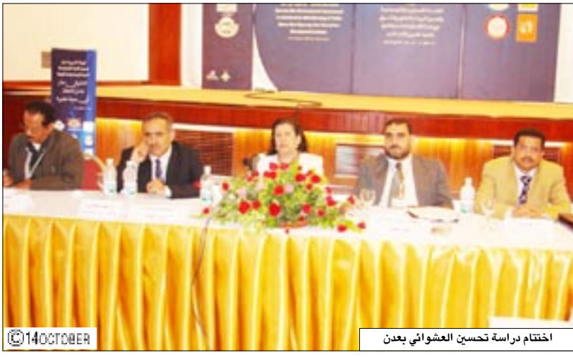
اختتام دراسة تحسين العشوائيات بعدين

□ عدن / واد شبيبي / سيأ، رفع المشاركون في ورشة العمل الإقليمية الثانية حول سبل تحسين الأحياء العشوائية بإقليم الشرق الأوسط وشمال إفريقيا، التي اختتمت أعمالها أمس في محافظة عدن، برقية لفخامة الأخ علي عبدالله صالح رئيس الجمهورية، لرعايته أعمال الورشة.. فخامة الأخ الرئيس علي عبدالله صالح رئيس الجمهورية .. نحن المشاركون في ورشة العمل التدريبية الثانية حول سبل تحسين الأحياء العشوائية في الإطار الوطني بإقليم الشرق الأوسط وشمال إفريقيا المنعقدة في مدينة عدن العاصمة الاقتصادية والتجارية للجمهورية اليمنية خلال الفترة من 10 - 12 نوفمبر 2007م، نرفع لفخامتكم أسمى آيات التقدير والاحترام بما حظيت به الورشة من رعاية وعناية من قبل فخامتكم والتي كان لها الأثر الكبير في الخروج بنتائج جيدة تجسد رؤية فخامتكم في تحسين الأوضاع البيئية والعيشية في الأحياء الشعبية.. ونتمن توجيهاًكم باعتماد 75 / مليار ريال على مدى الأعوام