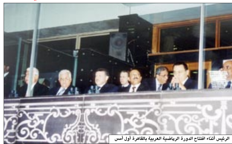
الرئيس أثناء افتتاح الدورة الرياضية العربية بالقاهرة أول أمس

□ عدن / سيأ، عاد فخامة الرئيس علي عبدالله صالح رئيس الجمهورية بسلامة الله وحفظه في ساعة مبكرة من صباح أمس إلى العاصمة الاقتصادية والتجارية عدن قادماً من العاصمة المصرية القاهرة بعد أن شارك في حفل افتتاح الدورة العربية للألعاب الرياضية الذي جرى هناك يوم أمس الأول. والتقى رئيس الجمهورية على هامش مشاركته في افتتاح الدورة عدداً من إخوانه القادة العرب المشاركين في حفل افتتاح الدورة وهم فخامة الرئيس محمد حسني مبارك رئيس جمهورية مصر العربية وفخامة الرئيس عمر حسن البشير رئيس جمهورية السودان وجمالاته الملك عبدالله الثاني ملك المملكة الأردنية الهاشمية ، وفخامة الرئيس جلال طالباني رئيس جمهورية العراق وفخامة الرئيس محمود عباس رئيس دولة فلسطين وسمو الشيخ سلمان بن حمد آل خليفة ولي عهد مملكة البحرين. حيث أجرى فخامة الأخ الرئيس مباحثات معهم تناولت سبل تعزيز العلاقات الأخوية بين بلادنا