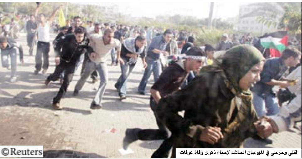
قتلى وجرحى في المهرجان الحاشد لإحياء ذكرى وفاته عرفات

□ فلسطين المحتلة/ 14 أكتوبر/ نضال المغربي، قال أحد المتظاهرين إن إطلاقاً للنيران أسفر عن سقوط ستة قتلى وأكثر من مائة جريح أمس الاثنين أثناء مراسم لإحياء ذكرى الرئيس الفلسطيني الراحل ياسر عرفات والتي جذبت مئات الآلاف من أنصار حركة فتح في غزة الواقعة تحت سيطرة حركة المقاومة الإسلامية (حماس). وتدفق بحر من أعلام حركة فتح صفراء اللون على ميدان في غزة في أكبر تجمع لحركة فتح التي يتزعمها الرئيس الفلسطيني محمود عباس في غزة منذ أن سيطرت عليها حماس في أعقاب اقتتال داخلي بين الفصائل في يونيو . ولكن الفوضى