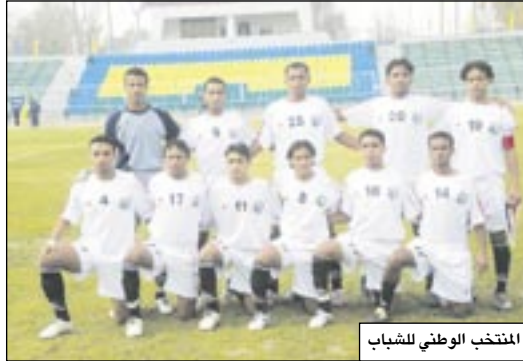
المنتخب الوطني للشباب

فيما خرج منتخب النيبال من المنافسة الفعلية على التأهل بدون نقاط بخسارته في الجولتين الأولى والثانية. ويخوض المنتخب الأحمر مباراته الثالثة والأخيرة أمام الأردن الجريح بعد غد السبت على نفس الملعب في تمام الساعة التاسعة صباحاً بتوقيت العاصمة صنعاء، فيما سيلعب بعدهما منتخب النيبال والأوزبك.