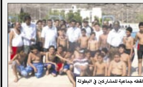
لقطة جماعية للمشاركين في البطولة