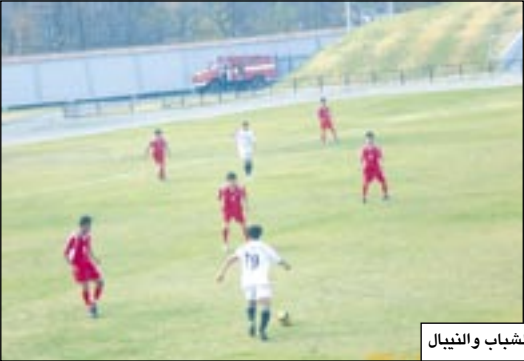
من مباراة منتخبنا للشباب والنيبالي