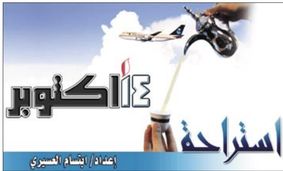
إعداد/ ابتسام العسيري

يعتبر شوي اللحم الأحمر على الفحم أسوء عدو للمعدة لا بل أنه العامل الرئيسي في خطر تطوير سرطان المعدة. ويشير الباحثون الإيطاليون الى أن المتهم الأول في ذلك هو القسم المحروق الموجود على شريحة اللحم المشوي كونه يحوي مواد الهيدروكربون الخطرة على الصحة. وينصح الباحثون اقتطاع الجزء المحروق من اللحم المشوي