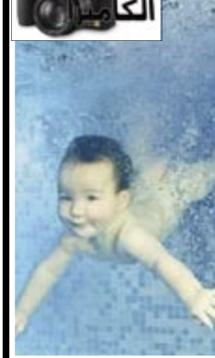
طرفة العين الكبار

وتوفي ديغول في عام ١٩٧٠ وقد حزن الفرنسيون والرأي العام العالمي على هذا القائد حزنًا كبيراً فقد أعطى لبلاده وللعالم الكثير والكثير وتركت بصمات واضحة على وجه التاريخ الحديث.