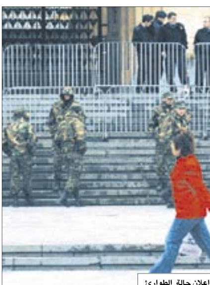
جنود في العاصمة تبليسي بعد اعلان حالة الطوارئ