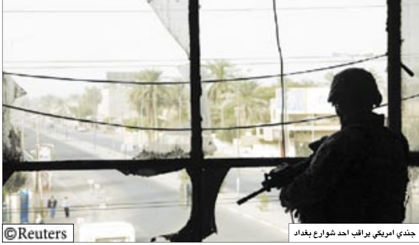
جندي امريكي يراقب احد شوارع بغداد