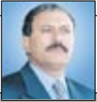
علي عبدالله صالح - رئيس الجمهورية