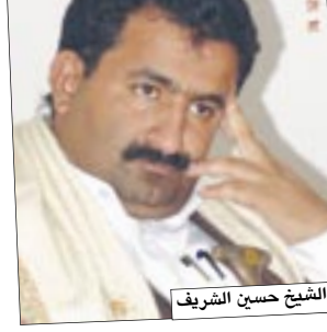
الشيخ حسين الشريف

أكد الشيخ حسين الشريف - نائب رئيس الاتحاد اليمني العام لكرة القدم أن الاتحاد يصدق الإعداد والتحضير لإقامة حفل تكريمي لمنتخب الناشئين تقديراً لمستوى الكروي الرائع الذي قدمه نجوم الأحمر الصغير، والذي توجه بالتأهل لنهائيات أمم آسيا صيف العام المقبل للمرة الثالثة في تاريخه.