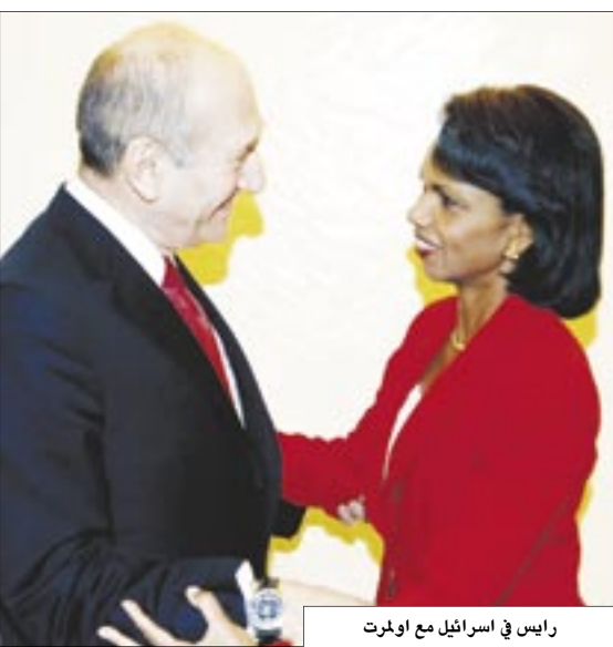
رايس في إسرائيل مع أولمرت

وقالت ليفني كبير مفاوضي إسرائيل في المؤتمر إن الدولة اليهودية مستعدة للمضي قدما في مباحثات مع الفلسطينيين وإن كان الوضع معقد... أكثر من أي وقت مضى . وقالت رايس ليفني إنها تأمل أن تساعد زيارتها في "الضيء" عندما في العمل الذي تقومون به بشكل ثنائي مع الفلسطينيين إلى جانب مواصلة التخطيط لاجتماعات نابوليس.