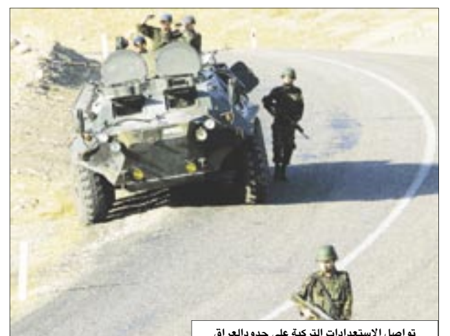
تواصل الاستعدادات التركية على حدود العراق

انقرة/ 14 أكتوبر/ رويترز: قال مسؤولون أمس الأحد انه تم في شمال العراق إطلاق سراح ثمانية جنود أتراك كانوا قد اختطفوا الشهر الماضي في كمين نصبه مقاتلو حزب العمال الكردستاني. وجاء إطلاق سراح الجنود بعد يوم من تعهد الحكومة العراقية بتعقب قادة الانفصاليين الأكراد المسؤولين عن شن غارات عبر الحدود على تركيا في ودا على ما اعتبرته ترددا من جانب الحكومة العراقية والولايات المتحدة. حشدت تركيا 100 ألف جندي على الحدود مع العراق وهددت بملاحقة عناصر حزب العمال الكردستاني إذ لم تبذل جهود لكبحه. وترد تركيا إلقاء القبض على قادة الحزب وإغلاق معسكراته بشمال العراق التي يستخدمها كقواعد لشن هجمات عبر الحدود في حملته التي بدأها قبل 23 عاما من أجل إقامة دولة في جنوب شرق تركيا.