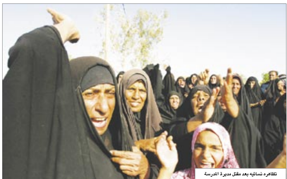
تظاهره نسائيه بعد مقتل مديرة المدرسة