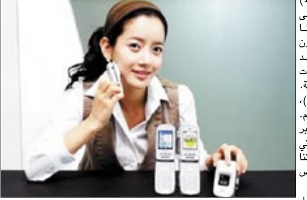
طرحت شركة بانتيك (Pantech) الكورية الجنوبية محصولاً جديداً قادر على توصيل رنة المحمول وصوت المتصل بنا مباشرة إلى الأذن عن طريق وضع الميكروفون الخارجي (Speaker) للمحمول الجديد على الفك السفلي. هكذا، تستطيع الموجات الصوتية الوصول مباشرة إلى الأذن الداخلية. ويدعى المحمول الجديد (A1407PT). وسيصل السوق اليابانية في الشهر القادم. لذا، يعتمد المحمول على نقل الصوت عبر عظمة الجمجمة اعتماداً على نفس الآلية التي تنشط عندما نتكلم وتجتهدنا نسمع نغمة صوتنا بصورة أضعف من تلك التي يسمعها الأشخاص الذين يحيطون بنا.

قد يبدو الأمر صعباً بالنسبة للنساء حين يقرنن تغيير ألوان شعرهن أو تجربة مواد تجميلية بألوان جديدة، فهن على الأغلب يضطرن للذهاب إلى صالونات التجميل لعمل التجارب التجميلية قبل اتخاذ القرار المناسب فيما يتعلق بالشكل واللون. لذلك فقد نظرت (Girl Tech) إلى تلك الحيرة بعين التقنية لتخرج بجهاز مبتكر يقوم بمساعدة المرأة على اختيار ألوان صبغة الشعر والمساحيق التجميلية وتجربتها قبل أي اختيار فعلي لتلك الألوان. يقوم جهاز (Digi Makeover) بتصوير الوجه من خلال الكاميرا الرقمية المنجدة بالجهاز وعرضها على شاشة تعمل باللمس بحيث تستطيع المرأة اختيار ما يناسبها من ألوان التجميل المتوفرة بالبرنامج الملحق بالجهاز، علاوة على إمكانية تغيير ألوان الشعر مباشرة للتعرف على الألوان المناسبة للبشرة الحقيقية. ويتم ربط الجهاز بشاشة التلفاز عبر الأسلاك المخصصة لذلك للحصول على صورة أوضح وأكبر من أجل التحكم بسهولة أكثر في تغيير الألوان وعمل الإضافات التجميلية اللازمة.