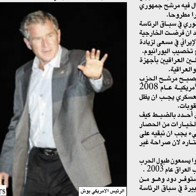
الرئيس الامريكي بوش

وأفاد دود وآخرون السناتور هيلاري كلينتون التي تقدم المرشحين الديمقراطيين في انتخابات الرئاسة لتصويتها