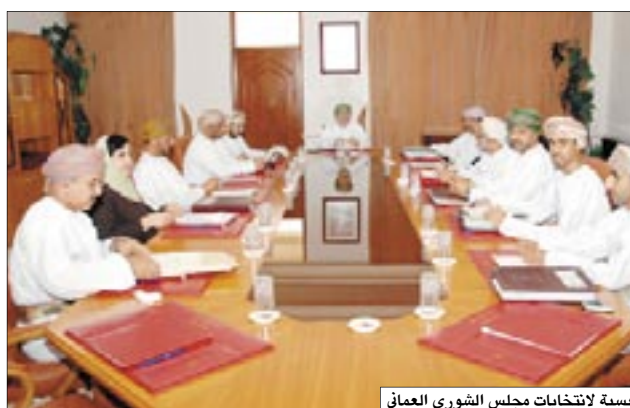
الجنة الرئيسية لانتخابات مجلس الشورى العماني التي يقل عدد سبائها عن (30) ألف سنتخب مرشحا واحدا فقط. جدير بالإشارة أن المواطنين العمانيين الذين في إطار السلطنة