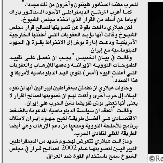
الرئيس الامريكي بوش

وأفاد دود وآخرون السناتور هيلاري كلينتون التي تقدم المرشحين الديمقراطيين في انتخابات الرئاسة لتصويتها