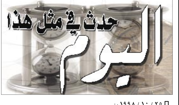
حدث في مثل هذا البروم

٢٥ / ١٠ / ١٩٩٨م بدء أعمال مؤتمر المرأة العاملة حول قضايا التنمية «حقوق المرأة العاملة. المواقف والمفاهيم السائدة تجاه المرأة العاملة والعمل الكريم». ٢٥ / ١٠ / ١٩٨٠م إفتتاح نقى الشهيد أحمد حمدي وهو نقى يمر تحت قناة السويس، ويستوعب نحو ٢٠ ألف سيارة يوميا. ٢٥ / ١٠ / ١٩٧٦م مؤتمر القاهرة - ١٩٧٦ الذي حضرته أربع عشرة دولة لاستكمال بحث الأزمة اللبنانية التي بدأت في المؤتمر السادس في الرياض. ٢٥ / ١٠ / ١٩٢٧م مولد سليمان متولي وزير النقل والمواصلات المصري السابق .