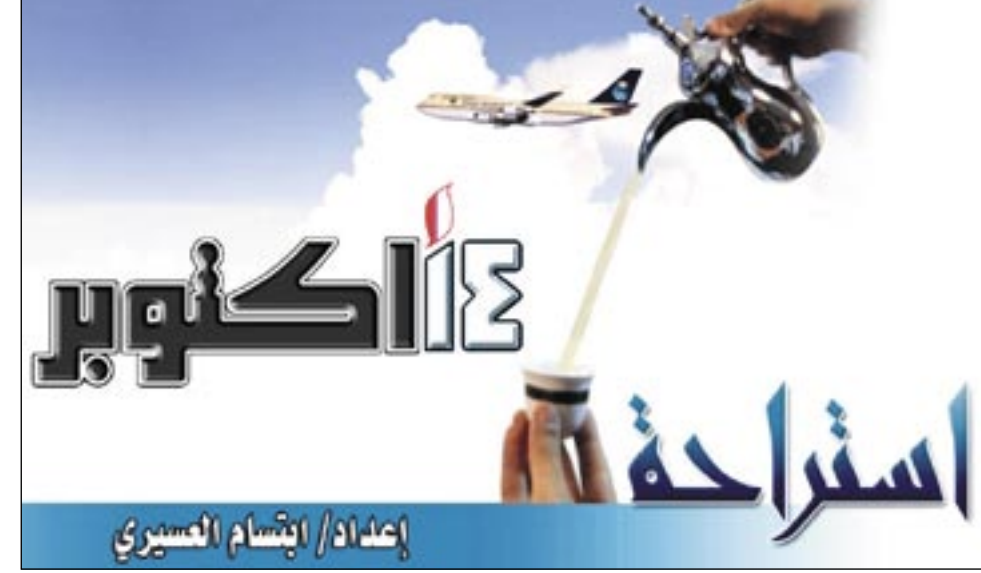
إعداد/ ابتسام العسيري

اعتبر الخبير ويليام بيتز الذي شارك الاثنان الماضي مؤتمراً حول البدانة في نيو أورلينز (لويزيانا، جنوب) انه يتعين الانتباه في مكافحة وباء البدانة الذي يصيب اوبهد 200 مليون شخص في الولايات المتحدة وحدها بالأساليب التي اتبعت في حملة مكافحة التدخين. وقال بيتز مدير الوقاية في المركز الفدرالي لمراقبة الأمراض والوقاية منها (سي.دي.سي): «النجاح في مكافحة التدخين كان سببه وجود استراتيجيات متعددة تشمل فرض ضرائب على السجائر وحظر بيعها للقصر ومنع التدخين في الاماكن العامة». واضاف هذا الخبير: «لا يمكن احدثا فارق في خلال اجراء واحد وانما من خلال عدة اجراءات في آن واحد، مشيراً إلى (بداية تغيير) ظهرت في العديد من الدراسات التي قدمت خلال المؤتمر السنوي لاجتبات البدانة الذي تنظمه مؤسسة (اوبيزيتي سوسايتي) التي تضم علماء اميركيين والتي انشئت منذ 20 عاماً لدراسة هذه الظاهرة المستخلقة. وقال بيتز: «لقد تطلب الأمر 40 عاماً لتغيير عادة امان التدخين فيما اعتقد اننا بدأنا الان فقط تغيير ظاهرة