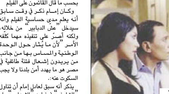
عادل إمام في مشهد من فيلم "السفارة في العمارة"

وقال إمام إن الانيا شنودة تفهم هدف تنفيذ الفيلم وهو معالجة مشكلة الفتنة العنصرية التي تطل برأسها بين حين وآخر على مصر. ومع ذلك قرر أن يبدأ