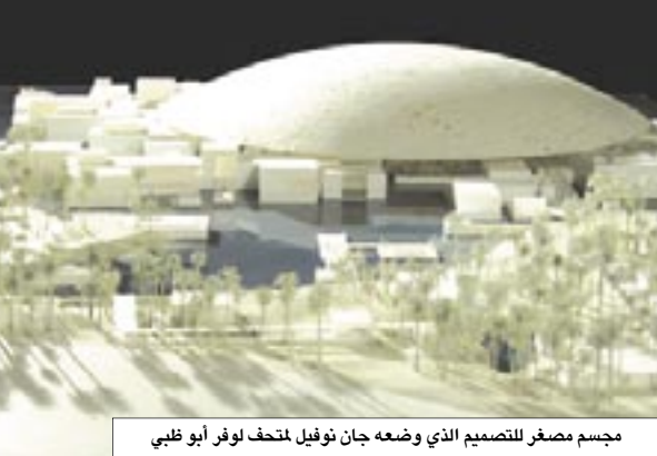
مجموع مصغر للتصميم الذي وضعه جان نوفيل لمتحف لوفر أبو ظبي