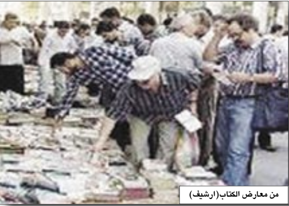
من معارض الكتاب (أرشيف)

ويتميز المعرض بما يوفره للزوار والضيوف من خدمات تسهل عليهم الوصول إلى متفاهم من الكتب بأسرع الطرق وأحدث الأساليب حيث يقدم المعرض خدمة البحث الإلكتروني المباشر عن عناوين الكتب المعروضة ودار النشر التي توجد فيها وموقعها من قاعة المعرض وذلك من خلال وحدة معلومات تقدم خدماتها على مدخل القاعة بالإضافة إلى الدليل الخاص بالناشرين المشاركين في موقع المعرض الإلكتروني على شبكة الإنترنت الذي يشمل مجمل المعلومات