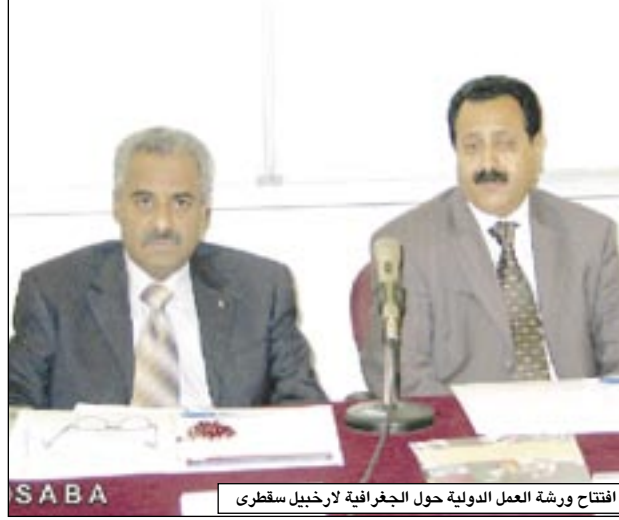
افتتاح ورشة العمل الدولية حول الجغرافية لجزيرة سقطرى