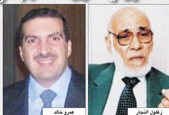
عمرو خالد زغلول التجار

في خطاب وجهه مصر وعمرو خالد والعوا والتجار على السلام بين المسلمين والنصارى . ودعا الخطاب الصابر باللغة الإنجليزية المسيحيين إلى كلمة سواء "بيننا وبينكم" ويذهب الخطاب إلى القول إن "حب إله واحد وحب الجار هما من أسس التفاهم المشترك بين المسيحية والإسلام ويستشهد الخطاب بالكثير من الآيات القرآنية المترجمة إلى الإنجليزية والكثير من الفقرات من الإنجيل التي تترنن على حب الإله الواحد وحب الجار في الديانتين . وقال موقعوا الخطاب إن الإسلام يأمرهم بدعوة أهل الكتاب للتفاهم وكلمة سواء فقالوا في خطابهم: ولذلك وطاعة للقرآن العظيم فإننا المسلمين ندعو النصارى لياتوا معنا على أسس ما هو مشترك بيننا". و جاء في الخطاب أن الكلمة سواء تعني الآية من سورة آل عمران في القرآن التي تقول: "قل يا أهل الكتاب تعالوا إلى كلمة سواء بيننا وبينكم إلا نعبد إلا الله ولا نشرك به شيئاً ولا يتخذ بعضنا بعضاً أرباباً من دون الله فإن تولوا فقولوا أشهدوا بأننا مسلمون". وأوضح علماء المسلمين في خطابهم: "مع الأسلحة الفتاكة في العالم الحديث ومع وجود المسلمين والمسيحيين في تداخل في كثير من أماكن العالم كله بشكل لم يسبق له مثيل، فإنه لن يكون هناك جانب واحد يمكنه الفوز بفقرده في نزاع بين أكثر من نصف سكان العالم وبدون سلام وعدالة بين الديانتين لن يكون هناك سلام له معنى في العالم. إن مستقبل العالم يعتمد