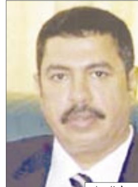
خالد محفوظ بساح

صنعاء/سبأ، أكد وزير النفط والمعادن خالد محفوظ بساح توافر مادة الغاز بكميات كبيرة في جميع محطات التعبئة والوكالات ومراكز البيع والتسويق في مختلف محافظات الجمهورية ولم يطرأ عليها أية زيادة في الأسعار فضلاً عن وجود كميات أخرى كافية في المخزون. وقال إن الوزارة حرصت على إيجاد احتياطي خاص من مادة الغاز للمناطق الساحلية، عدن، الحديدة وحضرموت التي تشهد ازدياداً كبيراً نتيجة انتقال عشرات الآلاف من المواطنين لقضاء إجازة العيد في هذه المحافظات، الأمر الذي يتطلب زيادة استهلاك الغاز فيها خلال إجازة العيد الذي يتزامن مع دخول فصل الشتاء البارد، وأشار إلى أن الوزارة عملت الاحتياطات اللازمة التتمة ص 2