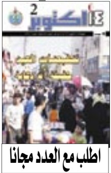
اطلب مع العدد مجانا