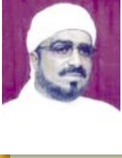
الشيخ / أنيس الحبشي

الدين هو أعظم ما يملكه الإنسان في مستقر الضمير وقد سمي الله دينه بالإسلام ، فقال : (( إن الدين عند الله الإسلام )) وهو الذي تضمن أسمى عقيدة امتزجت طبيعتها بماء التوحيد الصافي التابع من مهل النبوة الخالص والمخلص لله ! . وبهذه العقيدة استطاع النبي صلى الله عليه وسلم توجيه قريش نحو العهد الجديد معلناً انقلاب التاريخ بكل شجاعة تحدت مفاهيم الجاهلية وقيمها البالية ! ..