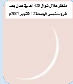
منظر هلال شوال 1428هـ في عدن بعد غروب شمس الجمعة 12 أكتوبر 2007م

نشرها في الصحيفة وأفاد فيها أن آخر رؤية للهلال في رمضان ستكون فجر يوم العاشر من شهر أكتوبر يتبعها استتار الهلال عن الرؤية، ثم ظهوره بعد مغرب يوم 12 أكتوبر الجاري إيداناً بحلول عيد الفطر المبارك في يوم السبت الموافق 13 من أكتوبر 2007م .