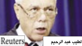
الطيب عبد الرحيم

قال الطيب عبد الرحيم أكبر من الرئاسة الإسرائيلية لكي تحقق الأمن لإسرائيل مقابل قيام الأخيرة بتوفير الغذاء والماء والكهرباء، لقاء غزة". ونفت حماس وجود أي اتصالات لعقد لقاءات مع القيادة الإسرائيلية لبحث إرساء الأمن مقابل الماء والكهرباء والغذاء. وقال عبد الرحيم "إن حركة حماس أصبحت تتوسل لقاء مع القيادة الإسرائيلية ولدينا تسجيلات تثبت ذلك". وسيطر حماس على قطاع غزة بعد ان تقبلت على قوات الأمن التابعة لحركة فتح التي يتزعمها الرئيس الفلسطيني محمود عباس التي يونيو في اعنف مواجهات مدمية شهدتها الأراضي الفلسطينية منذ تولي حماس السلطة في مارس عام 2006 مع فوزها الساحق على حركة فتح في ثاني انتخابات تشريعية شهدتها الأراضي الفلسطينية منذ اتفاقات أوسلو عام 1995.