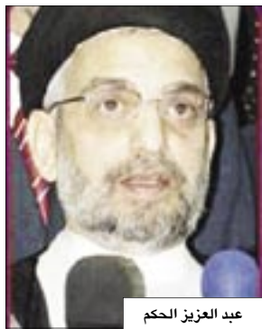
عبد العزيز الحكيم

أبناء شعبه التي تحققت إلى الآن، وشدد على أهمية التزام الأطراف المعنية ببنود الاتفاق التي ينتظرها الجمهور العراقي. وأشار إلى أن هناك توتر بين المجلس الأعلى الإسلامي والتيار الصدري، خصوصا في محافظات الجنوب ووصل عدة مرات إلى إحراق جيش المهدي التابع للصدر مكاتب المجلس الأعلى واشتباكات مسلحة.