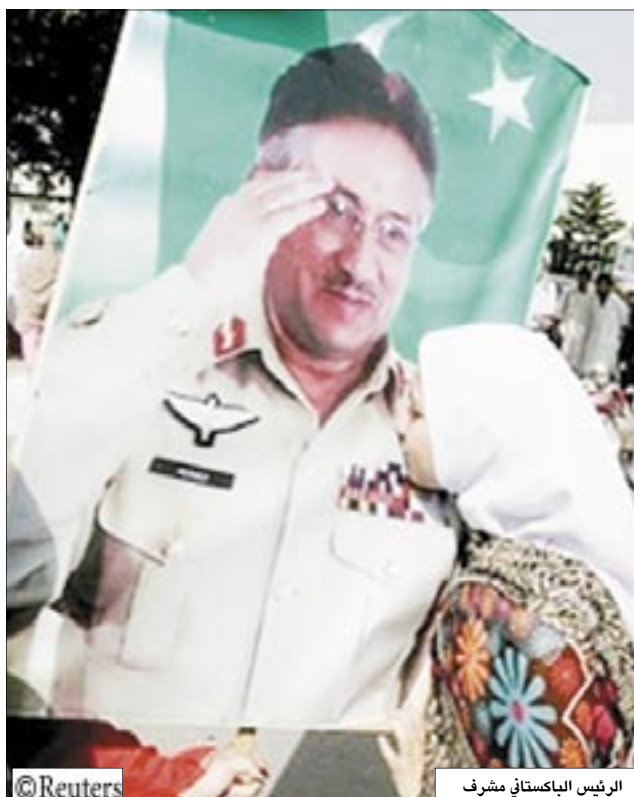
الرئيس الباكستاني مشرف

في 14 أكتوبر/من، كامران حيدر، حصل الرئيس الباكستاني برويز مشرف على معظم الأصوات في انتخابات الرئاسة التي جرت أمس السبت ولكن يتحتم عليه انتظار تأكيد المحكمة العليا شرعية ترشيح نفسه قبل إعلان فوزه.