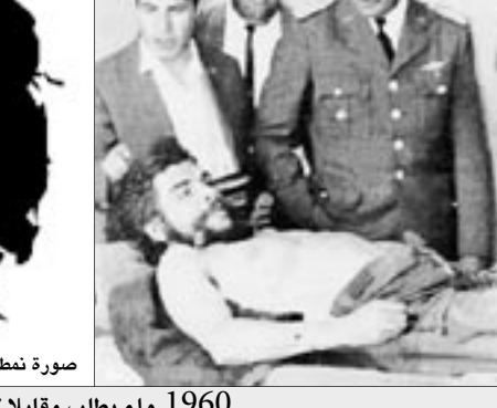
جيفارا بعد مدها بتقنية اعدامه