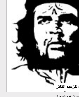
صورة نمطية للزعيم الثائر

وكان الأيرلندي جيم فيتزباتريك هو الذي أعاد إنتاج هذه الصورة رسمياً في أواخر الستينيات. ويقول فيتزباتريك لبي سي إن الطريقة التي قتلوه بها، وعدم وجود أثر لمكان دفنه، أو نصب لتخليد ذكراه، كل ذلك جعلني مصمماً على أن أنتج شيئاً يحظى بأوسع انتشار، إن صورته لن تموت، وإسمه لن يموت. وبالنسبة لتريشا زيف فإن قتل جيفارا يمثل بداية الأسطورة لصورته.