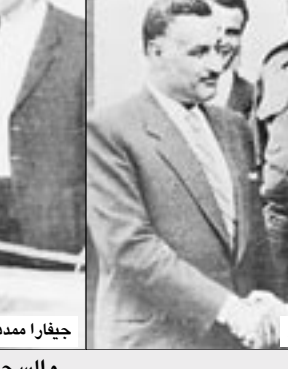
جيفارا بعد مدها بتقنية اعدامه

هي صورة لوجه شاب وسيم تشع عيناه العميقتان الحزبتان ذكاء وغضباً، حاجباه كثيفان، وشاربه خفيف، فيما أطلق لحيتته بغرض تنسيق أو اتساق، وقد ارتدى قبعة بسيطة وسترة أكثر بساطة، إنها صورة الثائر تشي جيفارا التي ربما تكون الأكثر انتشاراً في القرن العشرين. وتم الآن 40 سنة على مقتل هذا الثائر الأرجنتيني المولد في الوقت الذي انتشرت فيه صورته على القمصان والحوائط، وبات نجوم البوب يستخدمونها وحتى شركات الأيس كريم