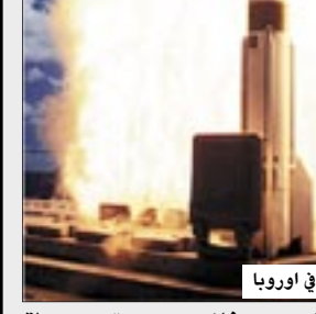
الدرع الصاروخي .. صراع في أوروبا

واشنطن / 14 أكتوبر / سبأ / بولنيغ، قال مسؤول أمريكي بارز إن الولايات المتحدة تريد معالجة المخاوف الأمنية الروسية إزاء خططها لنشر نظام للدفاع الصاروخي في شرق أوروبا خلال محادثات على مستوى رفيع في الكرملين في الأسبوع المقبل. وهناك خلافات بين الولايات المتحدة وروسيا منذ شهور بشأن خطط واشنطن لنشر درع للدفاع الصاروخي في أوروبا في جمهورية التشيك وبولندا تقول موسكو أنه سيضر بمصالحها القومية. وفي الوقت الذي تستعد فيه وزيرة الخارجية الأمريكية كوندوليزا رايس ووزير الدفاع روبرت جينس إلى موسكو في الأسبوع القادم لبحث الخلاف بدأ المسؤولون الأمريكيون أكثر ميلا للتصالح ورغبة في تجنب حدوث أزمة. وقال مساعد وزيرة الخارجية الأمريكية للشؤون الأوروبية دانييل فريد للصحفيين إن المقترحات الروسية بشأن الدفاع الصاروخي "جديرة بالاهتمام" مضيفاً أن الدولتين وحلف شمال الأطلسي يتعين أن يعملوا في نظام مشترك. وتقول واشنطن إنها بحاجة إلى الدرع لاستخدامه في الدفاع ضد صواريخ يحتمل أن تطلقها دول مارقة مثل إيران إلا أن روسيا تخشى من أن يستهدف هذا النظام التجسس عليها. وقال فريد إن واشنطن تريد أن تعمل روسيا وحلف شمال الأطلسي والولايات المتحدة معا في نظام مشترك أو شبكة من الأنظمة التي تعزز أمن كل طرف وتعالج المخاوف الروسية. وقال "لو كانوا جزءاً من نظام فقد يكونون أكثر ثقة في أنه ليس موجها ضدهم".