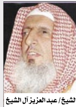
الشيخ / عبد العزيز آل الشيخ

وزاد: "معلوم أن أمر الجهاد موكول إلى ولي الأمر، وعليه يقع واجب إعداد العدة وتجهيز الجيوش، وله الحق في تسيير الجيوش والنداء للجهاد وتحديد الجهة التي يقصدها والزمان الذي يصلح للقتال إلى غير ذلك من أمور الجهاد