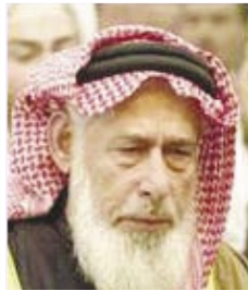
الشيخ / أحمد الكبيسي

وتابع يتم الجمع العصر مع الظهر والمغرب مع العشاء وهذه نظرية التشيع التي تقوم على مخالفة السنة في كل شيء“ .