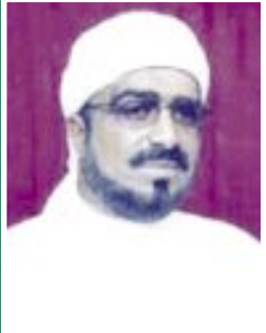
الشيخ أنيس الحبشي

ما أحوج الناس اليوم إلى موازين قراءة تشخيص عيار الرجال وموديل الشرف، وعراقة الأصل في كثيرين استوعبهم اهتمام المجتمع بأمرهم بعد تفشي الكذب، واعتلاء الباطل، وظهور فساد الضمائر إلى العلن حتى أصبح الصادق كذاباً، والكذاب صادقاً، والخائن أميناً، والأمين خائناً، ما أفسح المجال لكل دني لا يزن فلساً في شتى معايير الشرف أن يتربع على عرش المسؤولية فينتشر الظلم والبيغ والفساد ويدنو منه الأشقياء والتعساء، وينفر منه الحكماء والفضلاء فيجعل الله بينه وبين الحق سداً منيعاً لاتصل إليه أنوار الحق والحقيقة حتى تزل به القدم عن العرش أو يموت!