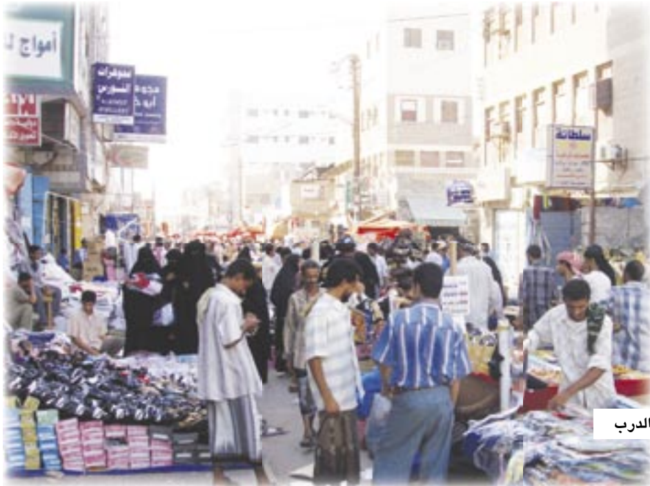
ت / علي الدرب