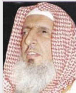
الشيخ / عبدالعزيز آل الشيخ

كما "وجد من بعض الشباب الذين خرجوا لما يظنون جهاداً، خلع بيعة صحيحة منعقدة لولي أمر هذه البلاد الطاهرة، بإجماع أهل الحل والعقد، وهذا محرم ومن كبائر الذنوب. ما أدى إلى وقوعهم فريسة سهلة لكل من أراد الإفساد في الأرض، واستغلال حماسهم حتى جعلوهم أفخاخاً متحركة يقتلون أنفسهم، لتحقيق مكاسب سياسية أو عسكرية لجهات مشبوهة". كما تم "استغلالهم من قبل أطراف خارجية، لإخراج هذه البلاد الطاهرة، وإلحاق الضرر والعنت بها، وتسليط الأعداء عليها، وتبرير مظالمهم فيها. وهذا من أخطر الأمور، إذ هذا الفعل منهم قد تعدى ضرره إلى الأمة المسلمة، وطال شره بلاداً آمنة مطمئنة، وفعلهم هذا فيه إدخال للوهن على هذه البلاد وأهلها". وزاد: "معلوم أن أمر الجهاد موكل إلى ولي الأمر، وعليه يقع واجب إعداد العدة وتجهيز الجيوش، وله الحق في تسيير الجيوش والنداء للجهاد وتحديد الجهة التي يقصدها والزمان الذي يصلح للقتال إلى غير ذلك من أمور الجهاد كلها موكلة لولي الأمر. بل