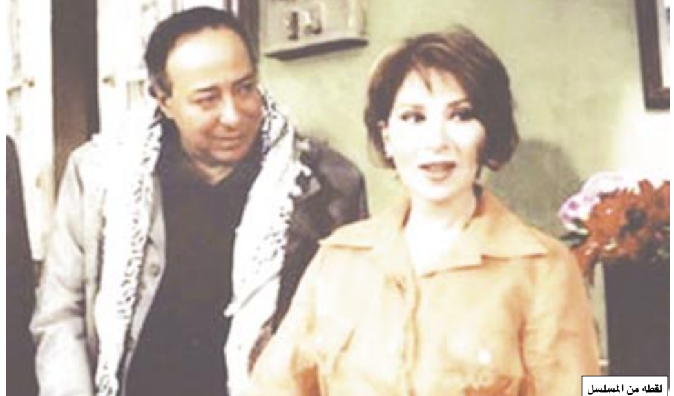
لقطة من المسلسل

خلال عرضه مرتكزا على ساق واحدة ورغم انه صالح للعرض الا انه لا يعبر عن حقيقة العمل . واكد ان الرقابة التلفزيونية كانت قد رفضت تصوير مشهد دفن أسرى مصريين أحياء اثر الانتصار الإسرائيلي السريع في حرب حزيران / يونيو كما حذفت خطوط حوار كثيرة حول التطبيع بين بطل المسلسل صلاح السعدني والشخصيات الأخرى في المسلسل.