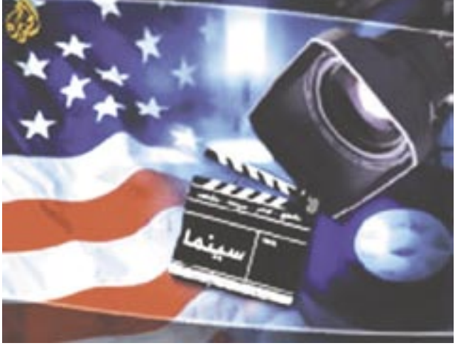
هوليود / متابعات،

حصد فيلم الحركة والخيال العلمي الجديد "الشر المقيم: انقراض" أعلى إيرادات للأفلام بأمريكا الشمالية بعد أن حقق مبيعات قدرها ٢٤ مليون دولار. والنسخة الجديدة من إخراج راسل مولكاي وإنتاج بول أندرسون، وهو الجزء الثالث لفيلم "الشر المقيم" الذي عرض عام ٢٠٠٢. وبدأ عرض الفيلم الجديد يوم ٢١ سبتمبر / أيلول الجاري في كل من الولايات المتحدة وكندا والمكسيك.