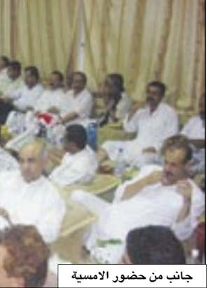
قيادة محافظة عن