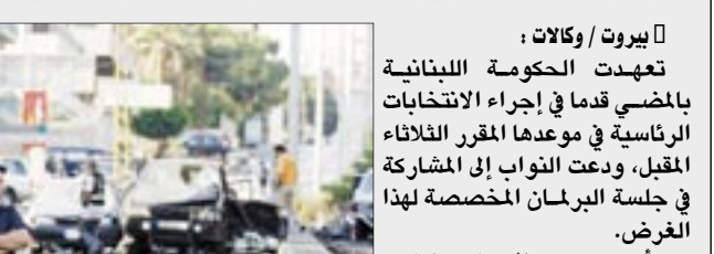
منطقة حادثة الاغتيال

مشدا على أن الأثرية النيابية مصررة على القيام بواجبها وانتخاب رئيس مهمما كانت المخاطر. وبموازاة ذلك حملت كتلة اللقاء الديمقراطي النيابية بزعامته وليد جنبلاط في بيان لها سوريا مسؤولية اغتيال النائب أنطون غانم بهدف إعادة الإطباق على لبنان ومؤسساته على مشارف الاستحقاق الرئاسي.