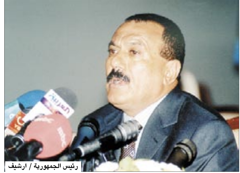
رئيس الجمهورية

600 كشاف ومرشدة يوقدون شعلة الثورة بعيدها الـ 45 :