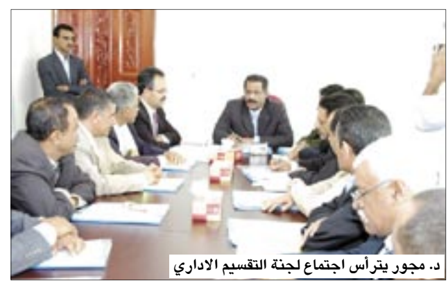
د. مجور يترأس اجتماع لجنة التقسيم الإداري

أطلع الدكتور علي محمد مجور رئيس مجلس الوزراء أثناء زيارته أمس لقر اللجنة الفنية للتقسيم الإداري للجمهورية، على الخطوات العملية التي أنجزتها اللجنة على طريق إعداد مشروع قانون التقسيم