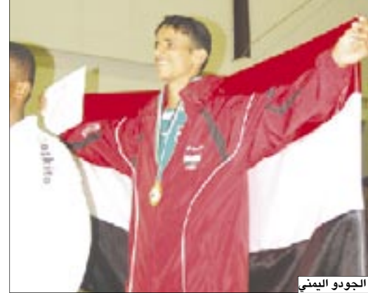
لاعبو منتخب الجودو اليمني