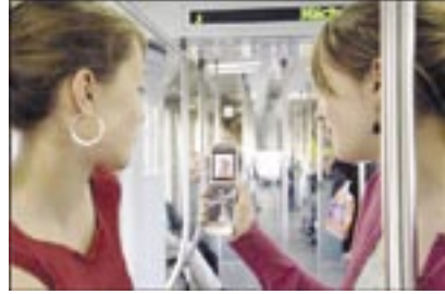
دون سابق إنذار! هذا ما يؤكد العلماء في مركز (Academic Medical Center) بجامعة أمستردام الهولندية. وشملت دراسة ٦١ نموذجاً من أجهزة التنفس الاصطناعية المستعملة في أقسام العناية الفائقة.

وأثبتت نتائج الدراسة أن عمل هذه الأجهزة قد يتوقف بسبب قربها من الهواتف المحمولة لا سيما إن كانت الأخيرة من الجيل الثاني، وُصّدت حوادث التعطل أو الخلل في عمل هذه الأجهزة ٥٠ مرة، وفي ٧٥ من المئة من الحالات كانت هذه الحوادث تجلب معها خطراً مرتفع الدرجة على المريض. علاوة على ذلك، كان أغلب حالات التشويش (٦٠ في المئة) بسبب إشارات (جي بي آر اس) (Gprs) من الجيل الثاني عليها إشارات (يو إم تي إس) (Umts) من الجيل الثالث (١٣ في المئة). في بعض الأحيان، كان تأثير المحمول سلبياً جداً حتى لو كان على بعد ثلاثة أمتار من سرير المريض. لذا، ينصح العلماء الهولنديون الجميع بإطفاء المحمول لدى زيارة بعض الأقسام، كما قسم العناية الفائقة.