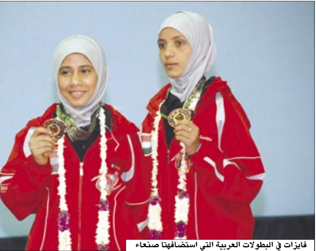
فائزات في البطولات العربية التي استضافتها صنعاء

المقر إقامته يوم السبت المقبل وبحضور عدد كبير من القيادات السياسية والرياضية أن يتم تكريم منتخب اليمن ناشئي الكرة الطائرة الحائز على البطولة العربية ناشئي كرة الطائرة، التي