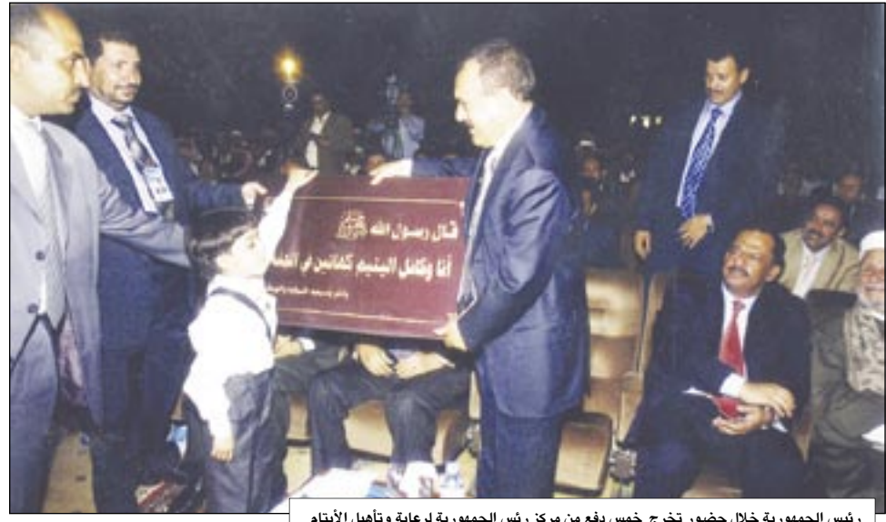
رئيس الجمهورية خلال حضور تخرج خمس دفع من مركز ريش الجمهورية لرعاية وتأهيل الأيتام