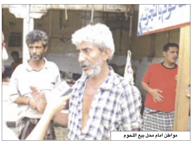
مواطن امام محل بيع اللحوم