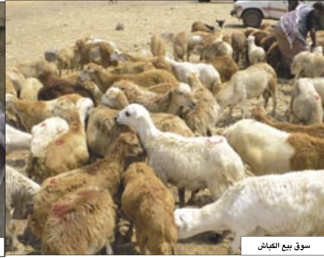
سوق بيع الكباش