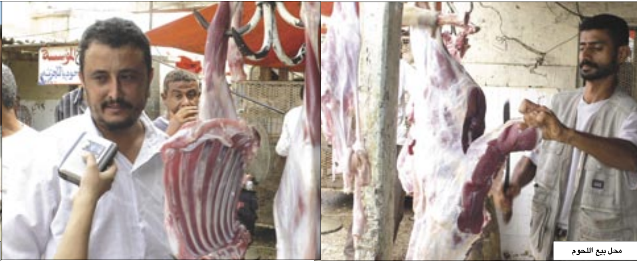
محل بيع اللحوم