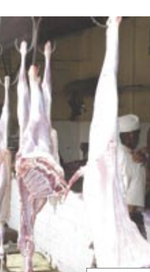
مواطن امام محل بيع اللحوم

البيطري المتواجد في إطار المديريات، هذه التقارير تشرح فيها الحالات المرضية التي يتم ملاحظتها أثناء الفحص على المشية سواء كان قبل الذبح أو بعد الذبح وأكثر الأمراض التي نلاحظها خلال فحصنا للحوم هي الأمراض الطفيلية الداخلية الدائمة مثل الديدان الكبدية والأكياس المائية ومختلف أنواع الديدان الشريطية التي تتواجد في المشية، سواء كانت من الديدان الكبدية والأكياس المائية التي تتواجد في المشية، سواء كانت من الأمراض الطفيلية الداخلية الدائمة مثل حويصلات الديدان الشريطية التي تكون متواجدة دائماً في اللحوم أو في المواشي المستوردة من القارة الإفريقية خاصة الثيران دائماً توجد بعض الانتهايات سواء كانت التهايات في الغدد للغفوية أو التهايات في الجهاز التنفسي أو التهايات في الرئة، وايضا نلاحظ الكسور هذه تعتبر أمراض غير