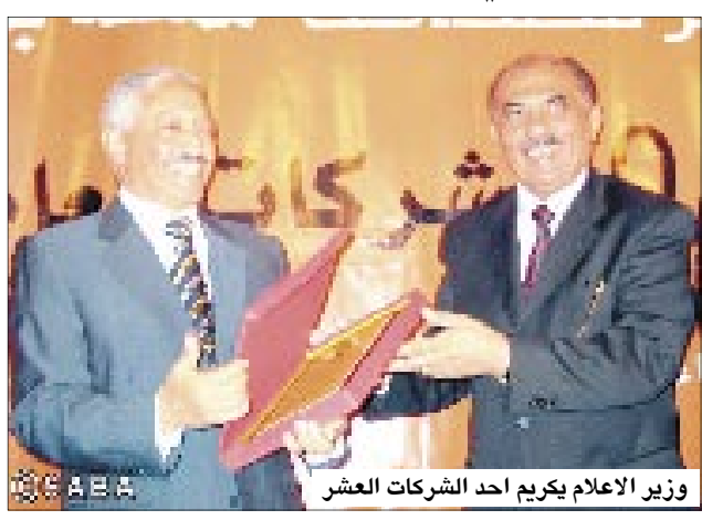
وزير الإعلام يكريم أحد الشركات العشر

أداء خلال العام المنصرم 2006م، وفقاً لنتائج استبيان أجرته المجلة بالتنسيق مع الهيئة العامة للاستثمار والاتحاد العام للغرف التجارية والصناعية، قال الأخ وزير الإعلام، إن مؤسسة المستثمر للمصافة حققت رسماً كبيراً من النجاحات في خدمة الاستثمار والترويج له وتصوير المستثمرين والمخضرمين والنشطاء بالاستثمار بالطريقة الواضحة لنجاح الاستثمار من خلال اللومعة والرأي والبيروتراتج والتحقيقات التي انتظمت على نشرها خلال ثلاث سنوات من الإصدارات المنتظمة للمجلة.