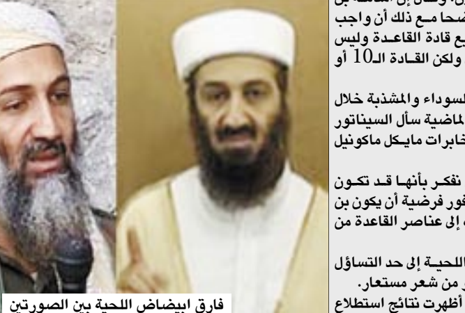
فارق ابيضاض اللحية بين الصورتين

الرأي العام في الولايات المتحدة أن نصف الأميركيين يعتبرون أن اعتقال بن لادن أقل أهمية من استقر العراق. وجاء في نتائج الاستطلاع الذي نشره معهد زغبي الفلاند أن 19% من الأشخاص الذين سئلوا عن رأيهم في مطاردة زعيم تنظيم القاعدة، اعتبروا أن ذلك يجب أن يوضع في إطار الحرب على الإرهاب، في حين اعتبر 41% منهم أنه يتوجب على الجيش قبل أي شيء آخر أن يتفرغ للاستقرار