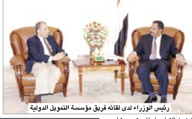
رئيس الوزراء لدى لقائه فريق مؤسسة التمويل الدولية

ناقش رئيس مجلس الوزراء الدكتور علي محمد مجور أمس مع الفريق الاستشاري التابع لمؤسسة التمويل الدولية برئاسة جوزيف بيلاط مسؤول السياسة والخدمات الاستشارية الاستثمارية جملة من القضايا المتعلقة بالمناخ الاستثماري العام في اليمن، واستعرض اللقاء إمكانية المساهمة الفاعلة للمؤسسة في دعم جهود الحكومة اليمنية في تطوير النظام المؤسسي لإدارة القطاع الاستثماري، وتشخيص المعوقات الاستثمارية على نحو دقيق وعلمي بما يكفل تجاوز الإشكاليات والذخع بالواقع الاستثماري إلى الأمام على المستويين المركزي والمحلي، وتطرق رئيس الوزراء إلى الإجراءات التي اتخذتها الحكومة لتطوير البيئة الاستثمارية بما في ذلك بدء تطبيق نظام