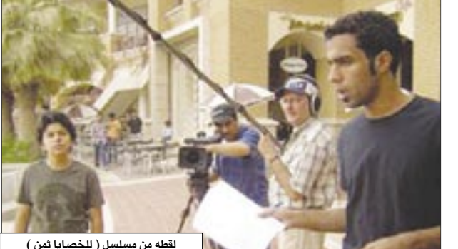
لقطة من مسلسل (للخطايا ثمن)