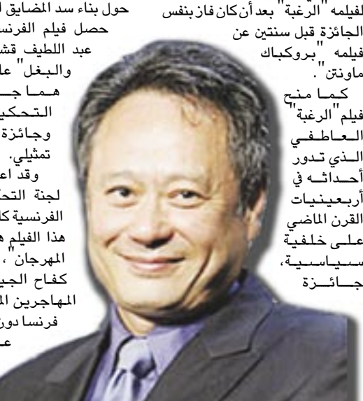
حصل فيلم الفرنسي التونسي عبد اللطيف قشيش "البذرة والبعل" على جائزتين هما جائزة لجنة التحكيم الخاصة وجائزة أفضل عمل تمثيلي . وقد اعتبرت لجنة التحكيم المخرجة الفرنسية كاترين بريرا أن هذا الفيلم هو اكتشاف كعاج الجيل الأول من المهاجرين المغاربيين إلى فرنسا دون أن يحصلوا على اعتراف لومنيك .