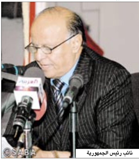
نائب رئيس الجمهورية