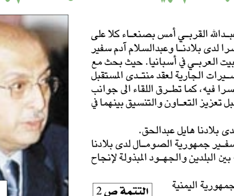
د. أبو بكر القربي