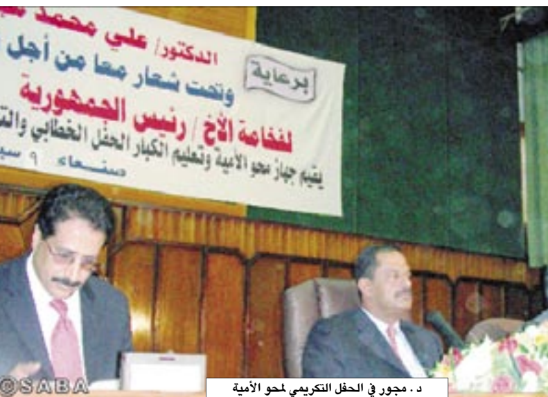
د. مجور في الحفل التكريمي لمحو الأمية

□ صنعاء / 14 أكتوبر / سيأ، أكد الدكتور علي محمد مجور، رئيس مجلس الوزراء توجه الحكومة لتسوية الأوضاع التعاقدية العاملين في مجال محو الأمية تقديراً لجهودهم الوطنية وتفخيراً لهم للمزيد من البذل والعطاء في تأدية مهامهم النبيلة لمحو الأمية، مشمناً الجهود الطبية التي يبذلها الجنود المجهولون من العاملين في مجال تنفيذ البرامج الحكومية لمحو الأمية وتعليم الكبار على مستوى العاصمة والمحافظات. وفي كلمته بالحفل الخطابي والتكريمي الذي نظمه أمس جهاز محو الأمية وتعليم الكبار بمناسبة اليوم العالمي لمحو الأمية، أكد رئيس الوزراء أن مكافحة الأمية مسؤولية وطنية وتكاملية بين الدولة والشعبية، داعياً هذه الفعاليات للاجتماعية والمساهمة في جعل عدن مدينة نموذجية خالية من الأمية، بحيث يتم لاحقاً تعميم هذه التجربة على بقية المحافظات. (التفاصيل ص 7)