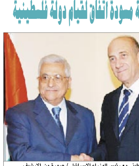
الرئيس الفلسطيني مع رئيس الوزراء الإسرائيلي

فلسطين المحتلة / 14 أكتوبر / وفاء عمرو، قال مساعدو الرئيس الفلسطيني محمود عباس إن عباس سيستعد للحضور على تعهد من رئيس الوزراء الإسرائيلي إيهود أولمرت بالبدء في صياغة مسودة اتفاق مقترح بخصوص مبادئة قيام دولة فلسطينية خلال محادثات تجري اليوم الاثنين. وأضافوا أن أولمرت وعباس اللذين سيجتمعان في القدس أحزرا بعض التقدم في المحادثات في الأوتة الأخيرة تجاه تصحيح الخلافات حول طبيعة الدولة الفلسطينية في المستقبل قبل مؤتمر للسلام ترعاه الولايات المتحدة من المتوقع أن يعقد (التتمة ص 2)