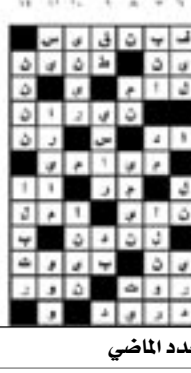
حل العدد الماضي