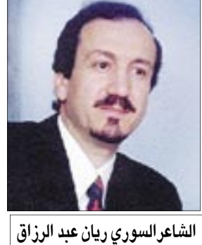
الشاعر السوري ريان عبد الرزاق

أما في الإلهيات فهو يدافع عن الحرية المطلقة لفعل الله أثناء الخلق، أسهم في الشك المنهجي استهدف في شكه الوصول الي اليقين وأسباب الشك لديه أنه يلزم أن نضع موضع الشك جميع الأشياء بقدر الأمكان ويدير الشك أنه تلقى كثيرا من الآراء الباطلة وحسبها صحيحة فكل ما بناه منذ ذلك الحين من مبادئ على هذا القدر من قلة الوثوق لا يكون إلا مشكوكا فيها إذن يلزم أن نقيم شيئا متينا في العلوم أن نبدأ بكل شئ من جديد وأن توجه النظر إلى الأسس التي يقوم عليها البناء مثال المعطيات الخاصة للحواس فالحواس تخدعنا أحيانا والأفضل الا نشق بها أما الأشياء العامة كالعيون والروس والأيدي التي يمكن أنتكأف منها الخيالات يمكن ان تكون نفسها خيالية حمضة. التي تدمجها مع الجبر . يعارض ديكارت الكثير من أفكار أسلافه ، ففي مقدمة عمله عاظمة الروح Passions of the Soul ، يذهب بعيدا للتأكد أنه سيكتب في هذا الموضوع حتى لو لم يكن أحد سبقه لطرح هذا الموضوع. بالرغم من هذا فإن العديد من الأفكار توجد بذورها في الأرسطية المتأخرة و الرواقية -Stoi Cism في القرن السادس عشر او في فكر أوغسطين. يعارض ديكارت هذه المدرسة في نقطتين أساسيتين : أولا يرفض تقسيم الجسم الطبيعية إلى مادة و صورة (شكل) كما تفعل معظم الفلسفات اليونانية . ثانيا يرفض الغايات أو الأهداف سواء كانت غايات ذات طبيعة إنسانية أو إلهية لتفسير الظواهر الطبيعية .