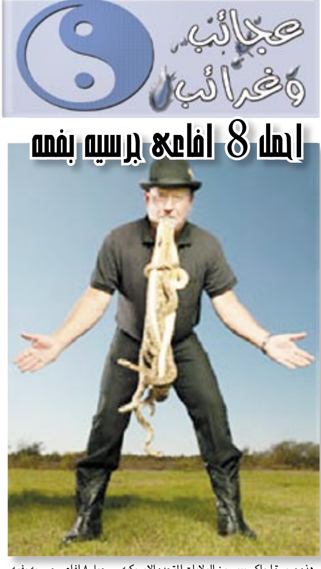
هذه صورة لجاكي بيببي من الولايات المتحدة الأمريكية ... حمل ٨ افاعي جرسية بفمه من ذيولها وذلك لمدة ١٢ ثانية .