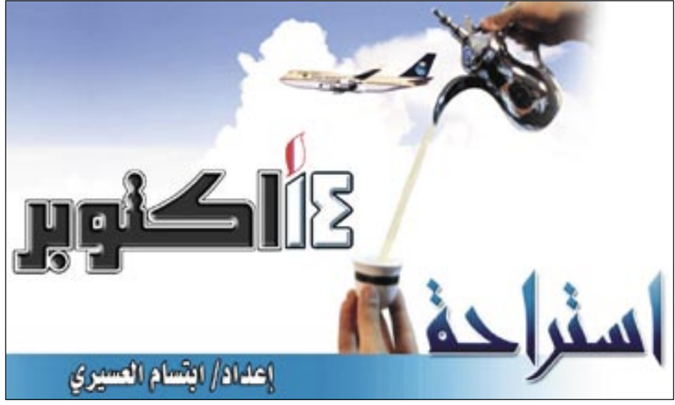
إعداد/ إنسام العسيري

نيويورك / متابعات ، قالت شركة سوني كورب لصناعة الاجهزة الالكترونية الاستهلاكية الخميس المنصر انها ستطرح نموذجا جديدا للسوق الأميركي من مشغلات (ووكمان) الموسيقى به قدرة على تشغيل فيديو رقمي وهو أحدث منافس محتمل للمشغلات الاعلامية (اي بود) التي تنتجها شركة آبل والتي تستحوذ على حصة كبيرة في السوق. وأوضحت الشركة اليابانية وهي إحدى أكبر الشركات المصنعة للمنتجات الالكترونية في العالم أن جهازها (ان دبليو زد-ايه) وان دبليو زد-اس) من عائلة مشغلات (ووكمان) الموسيقية الرقمية سيترخان في الاسواق في سبتمبر. وسيدعم الجهازان برنامجا مفتوحا بمعنى أنهما سيشتغلان صوراً متنوعة من الموسيقى الخاصة بأجهزة (ام بي ٣) و(دبليو ام ايه) التي تنتجها شركة مايكروسوفت كورب بما يقدم مزيدا من الخيارات للتحميل وتشغيل الموسيقى ومجموعات الفيديو على الانترنت. وأضافت سوني انها ستزيل جميع القيود بشأن ربط خدماتها الموسيقية التي توزع الموسيقى بتصميم (اي تي ار ايه سي) الصوتي الملوك لسوني في أميركا الشمالية وأوروبا. وستقاوت الموعد لإزالة كل قيد على حدة لكن التحرك لن يبدأ قبل مارس اذار ٢٠٠٨م. وقالت سوني إن نماذج غير البطارية تسمح بتشغيل الفيديو بما يصل إلى ثماني ساعات في أجهزة (ان دبليو زد-ايه) التي سيبيع الجهاز الواحد منها بما يتراوح بين ١٤٠ دولارا و٢٣٠ دولارا. أما في أجهزة (ان دبليو زد-اس) فان عمر البطارية سيكون أكثر من تسع ساعات تشغيل وسيتراوح سعر الجهاز بين ١٢٠ دولارا إلى ٢١٠ دولارا.